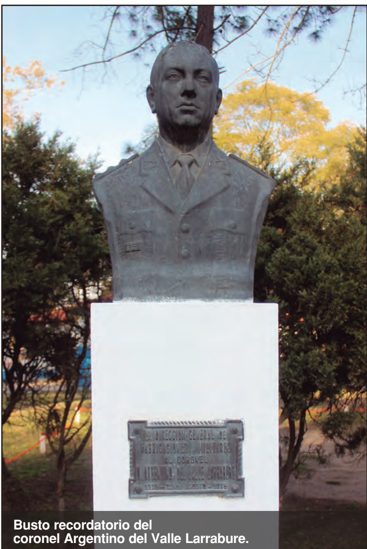
Busto recordatorio del coronel Argentino del Valle Larrabure.