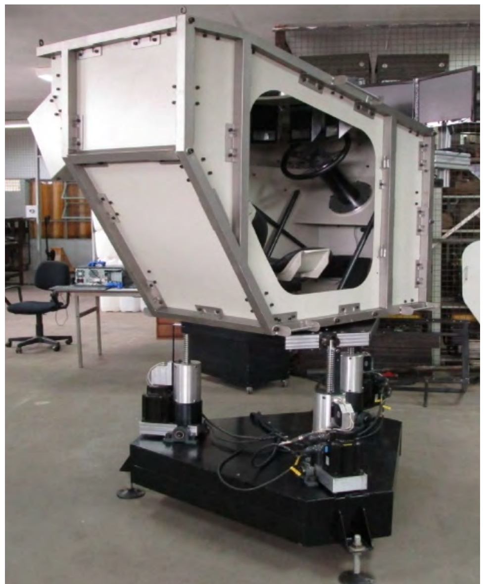
Simulador de conductor de tanque.