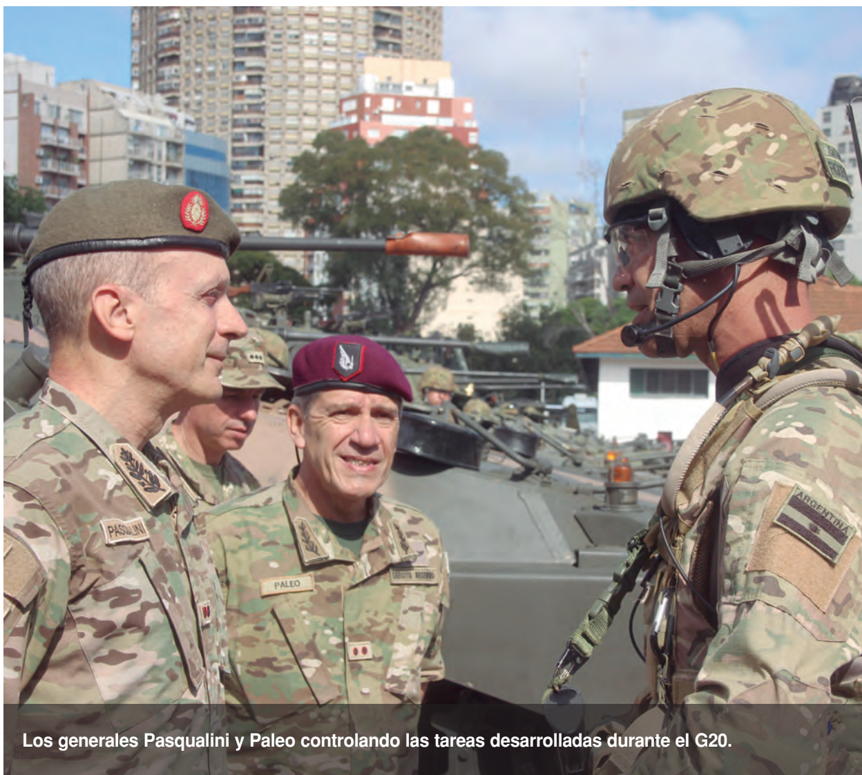
Los generales Pasqualini y Paleo controlando las tareas desarrolladas durante el G20.