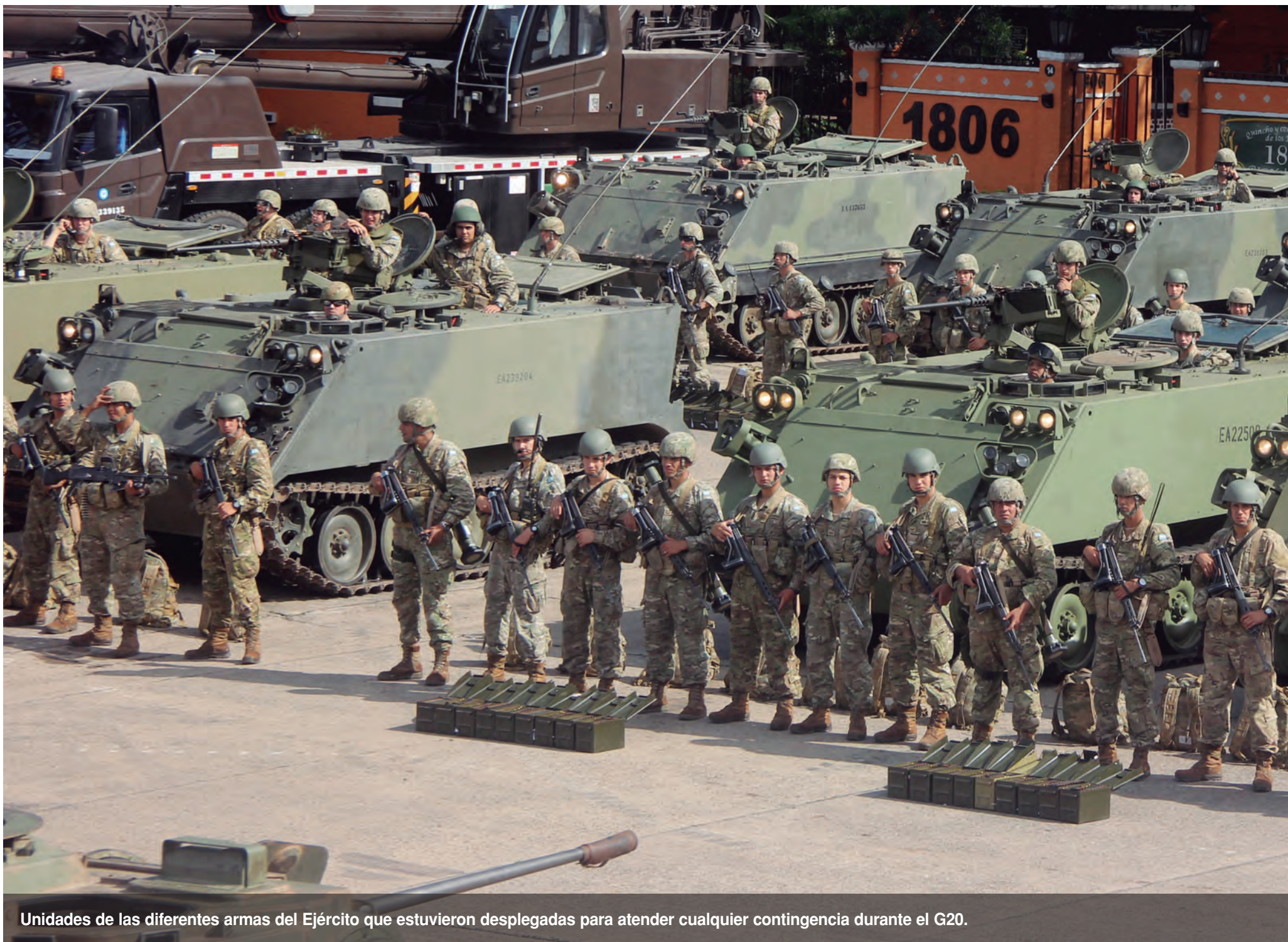
Unidades de las diferentes armas del Ejército que estuvieron desplegadas para atender cualquier contingencia durante el G20.

El Ejército Argentino alistó su personal, medios y equipamiento para dar apoyo a las Fuerzas de Seguridad ante un eventual requerimiento durante la cumbre de líderes del G 20 que se desarrolló en Buenos Aires. Sus miembros permanentes representan a 19 países y se suma un invitado permanente por la Unión Europea. En la actualidad es el principal espacio de deliberación política y económica del mundo.