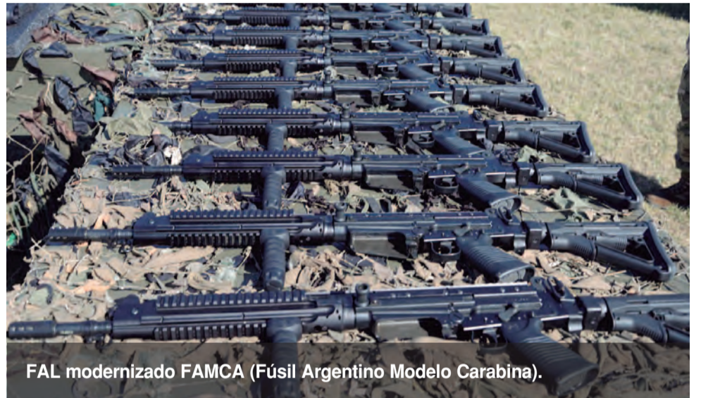
FAL modernizado FAMCA (Fúsil Argentino Modelo Carabina).