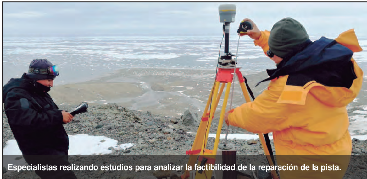
Especialistas realizando estudios para analizar la factibilidad de la reparación de la pista.

Una comisión del Departamento Obras en Apoyo al Desarrollo Nacional (ODENAC), a solicitud del Comando Conjunto Antártico, se desplazó hasta la Base Antártica Marambio con la finalidad de estudiar la factibilidad de reparación de la pista de aterrizaje principal. Durante las campañas de verano resulta complicada su operación ya que las temperaturas a veces son inferiores a los -2°C y se encuentra emplazada sobre un suelo de permafrost (una mezcla de roca, hielo y materia orgánica que permanece a una temperatura de 0°C).