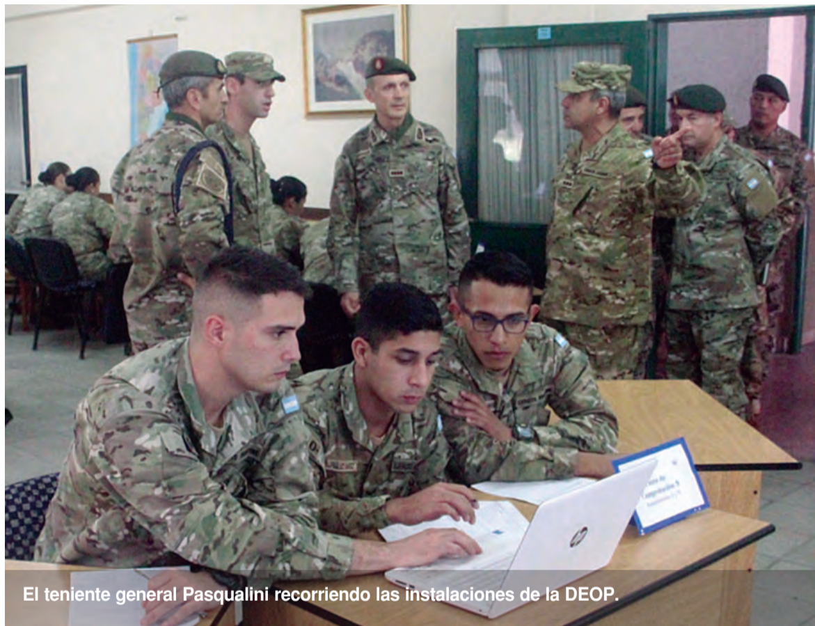
El teniente general Pasqualini recorriendo las instalaciones de la DEOP.

En el salón de actos lo esperaban reunidos los alumnos del Curso de Perfeccionamiento Básico. Allí tuvo la oportunidad de tener un contacto directo con los cabos y exponer sobre la misión, la visión y los valores del Ejército. También pudo transmitirles algunas cuestiones relacionadas con el proceso de Reconversión del Ejército: etapa de ordenamiento, una segunda etapa de optimización y de transformación. Manifestó que las prioridades del Ejército para este año están centradas en la educación y en el adiestramiento operacional de sus cuadros. Finalmente respondió inquietudes de los cursantes