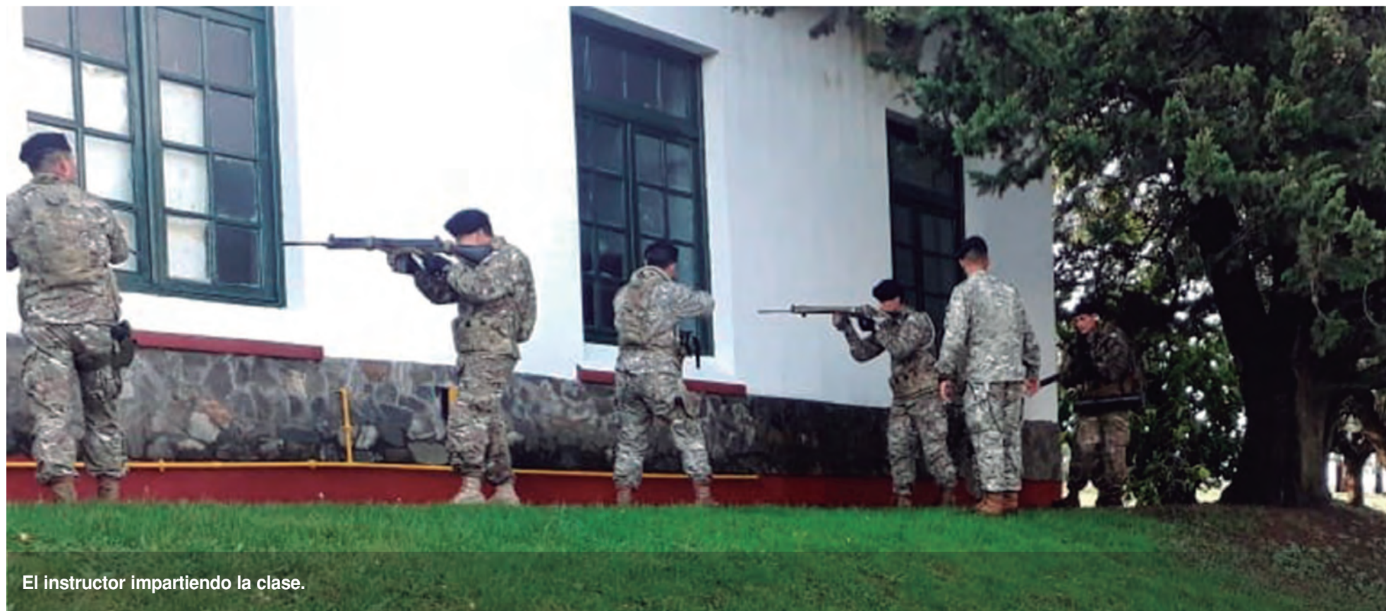
El instructor impartiendo la clase.

Logístico Tandil, Escuadrón de Inteligencia Blindado 1 y el Escuadrón de Comunicaciones Blindado 1. Asimismo, este cursillo se impartirá en diferentes unidades de la brigada.