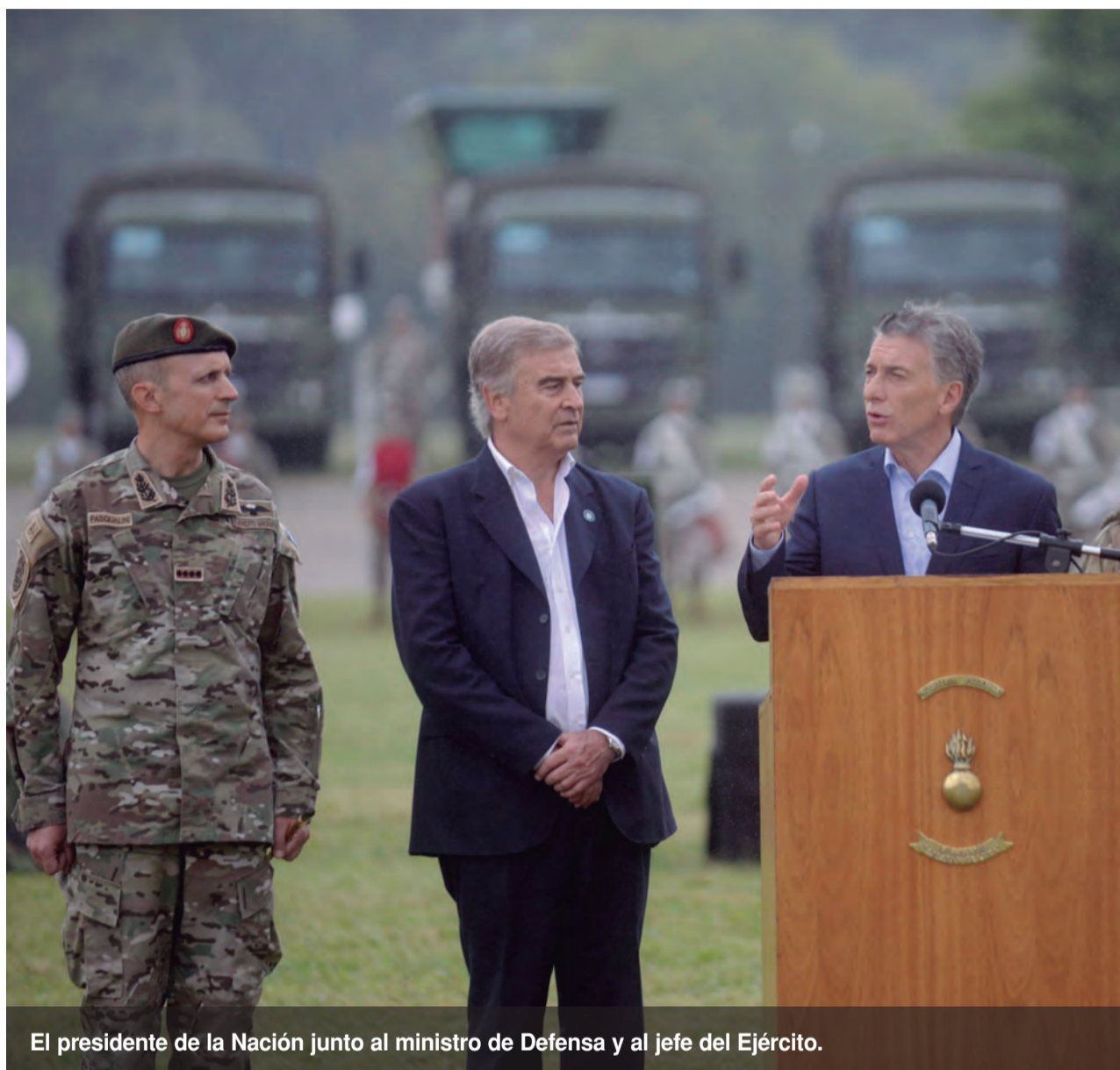
El presidente de la Nación junto al ministro de Defensa y al jefe del Ejército.