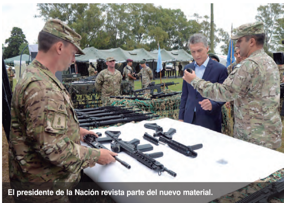
El presidente de la Nación revista parte del nuevo material.