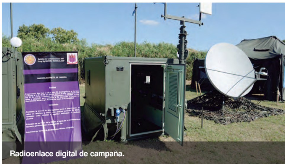
Radioenlace digital de campaña.