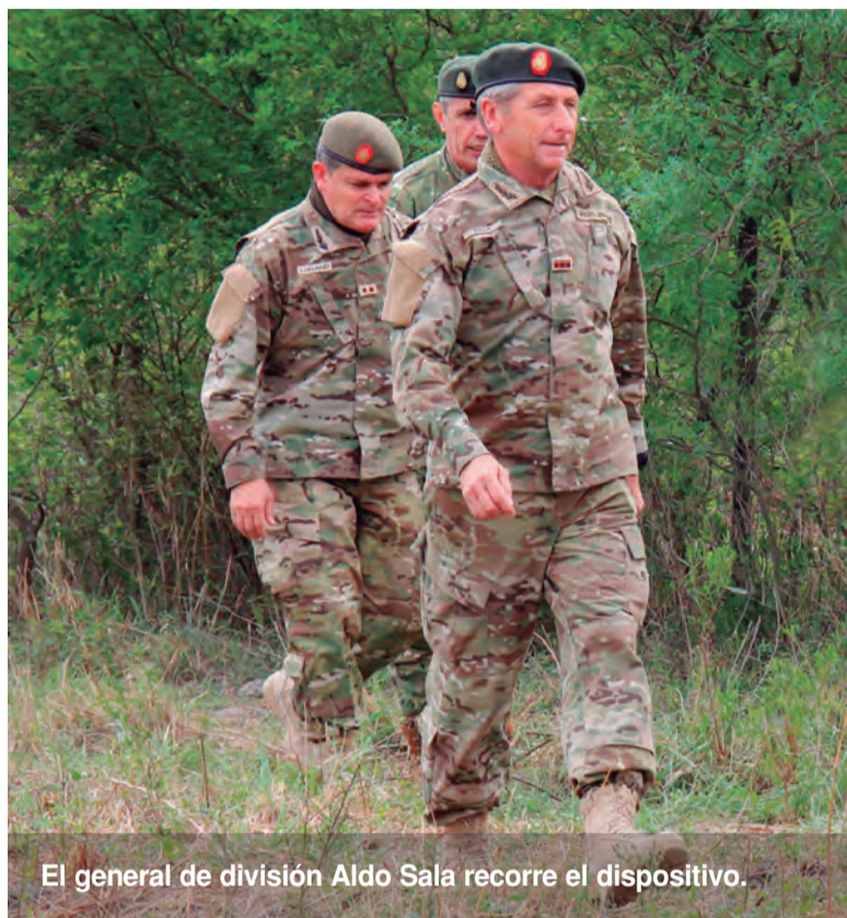
El general de división Aldo Sala recorre el dispositivo.

E l general de división Aldo Sala, comandante de Adiestramiento y Alistamiento del Ejército, en cumplimiento de sus funciones recorrió y controló las actividades realizadas por parte de elementos subordinados en la frontera Norte del país como integrantes del Operativo Integración Norte. Este comando es el responsable de mantener la fuerza operativa del Ejército Argentino con el pie de instrucción y adiestramiento necesario para ser puesto a disposición de un comando operacional en caso de empeñarse el poder militar. Durante el transcurso de esta actividad, el general de división Sala se refirió a los temas desarrollados.