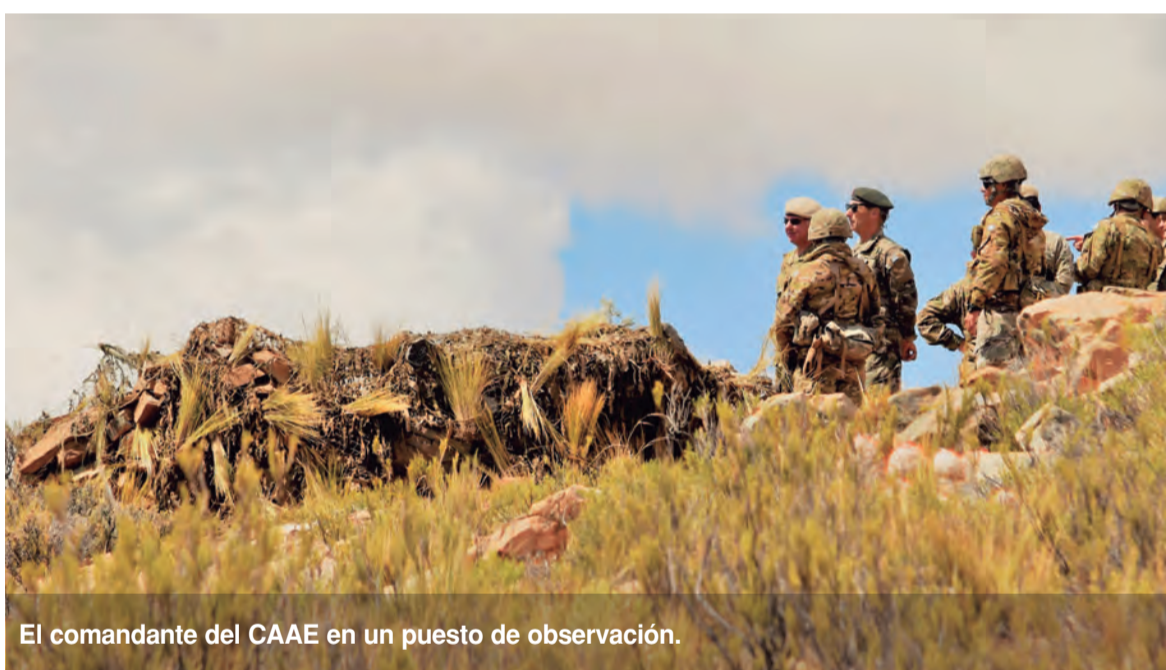
El comandante del CAAE en un puesto de observación.