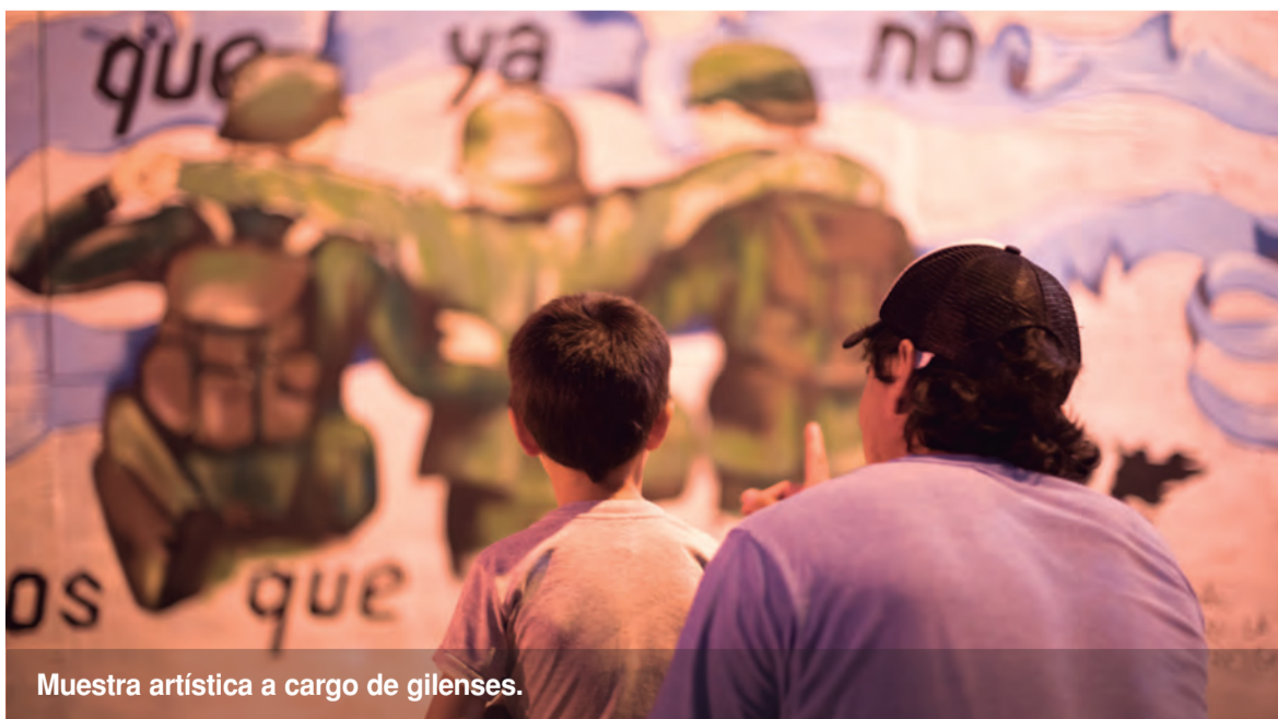
Muestra artística a cargo de gilenses.

Cerca del paso al 2 de abril, comenzaron a encenderse de a una las históricas 649 antorchas. Sin lugar a dudas, en esos momentos