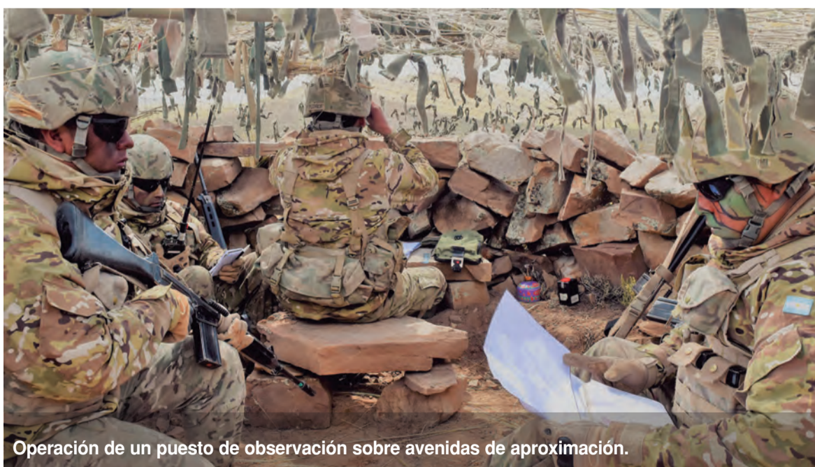
Operación de un puesto de observación sobre avenidas de aproximación.

que se ponen a disposición. Hace poco el presidente de la Nación hizo entrega efectiva de todo tipo de materiales, algunos de avanzada tecnología. Ello permitirá aumentar las capacidades de la gente que está trabajando en el Norte. Recordemos que el Ejército es una institución del Estado y está operando en zonas que