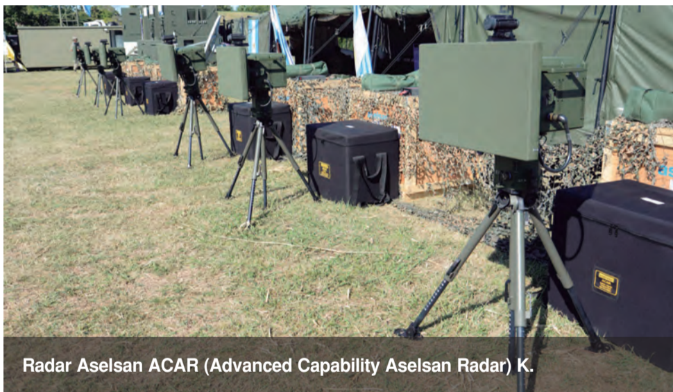
Radar Aselsan ACAR (Advanced Capability Aselsan Radar) K.