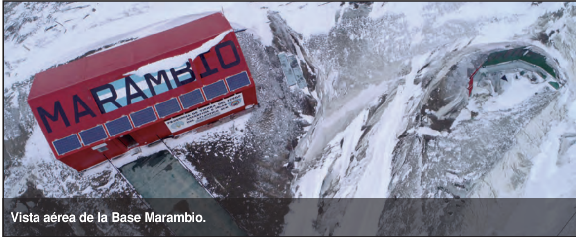
Vista aérea de la Base Marambio.