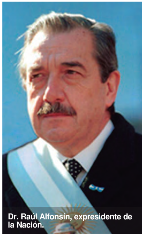
Dr. Raúl Alfonsín, expresidente de la Nación.