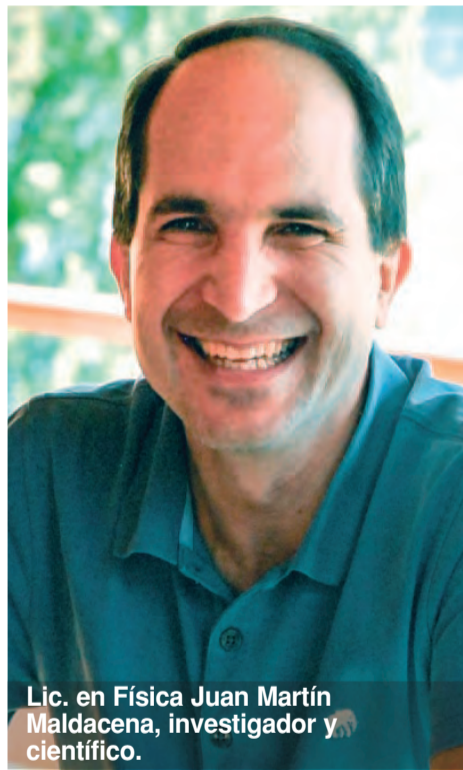
Lic. en Física Juan Martín Maldacena, investigador y científico.