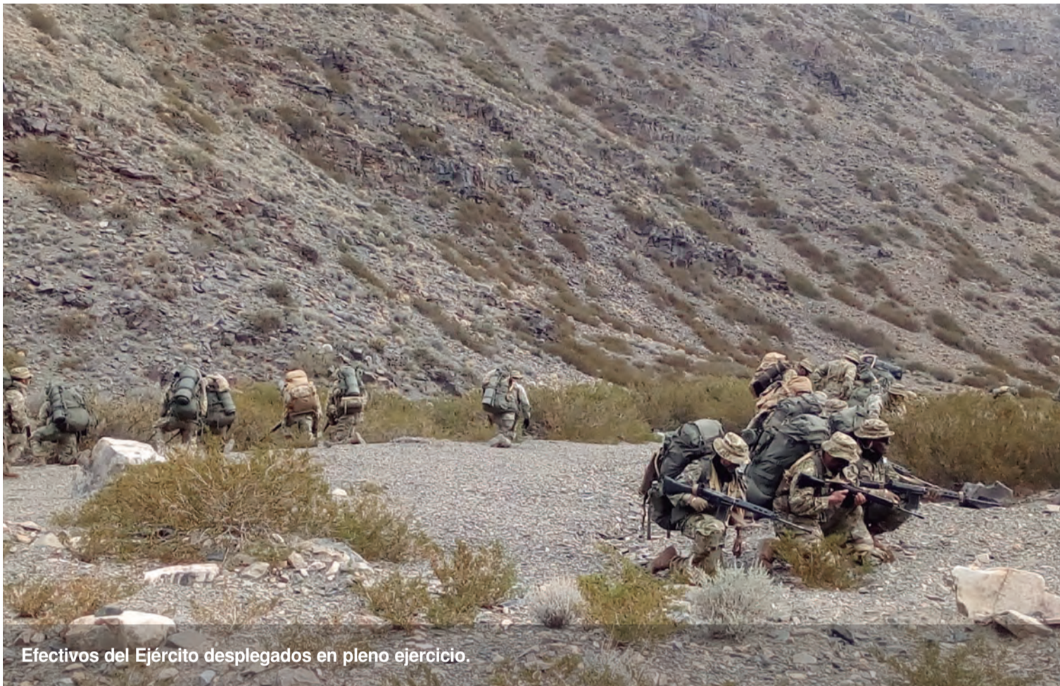
Efectivos del Ejército desplegados en pleno ejercicio.

El cursillo se inició con las comprobaciones físicas básicas, a las que se le sumaron aquellas consideradas específicas, como la viga de equilibrio y trepar la cuerda. En los días posteriores, se dictaron clases teóricas y las instrucciones prácticas sobre temas de cartografía, sanidad en montaña, técnica en roca, vida y movimiento, y supervivencia en montaña. Como prueba final, los alumnos realizaron un examen que consistió en una escalada en roca y una ascensión a un cerro con altura mayor a 4.000 metros. La duración total del curso fue de 12 días y tuvo un total de 163 cursantes.