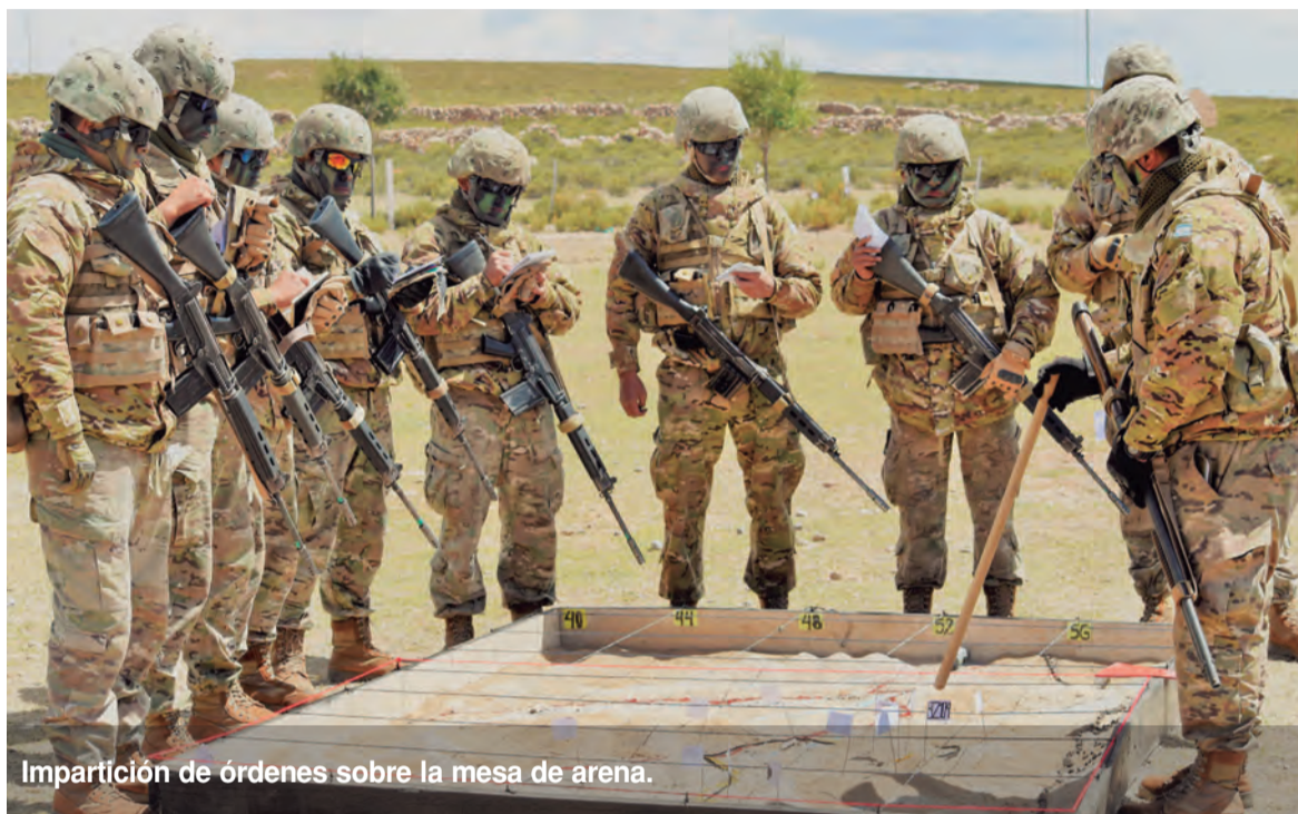
Impartición de órdenes sobre la mesa de arena.

- Justamente estamos proyectando una ampliación paulatina que se efectuará mes a mes. Se está incrementando la cantidad de gente que participa y no solo ello sino que también las capacidades de los medios