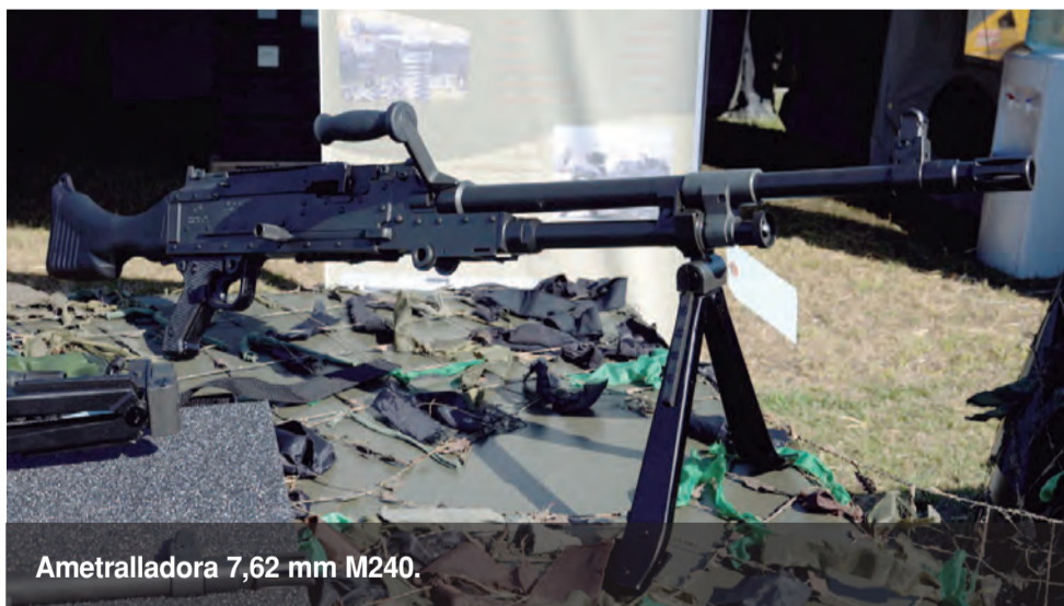
Ametralladora 7,62 mm M240.