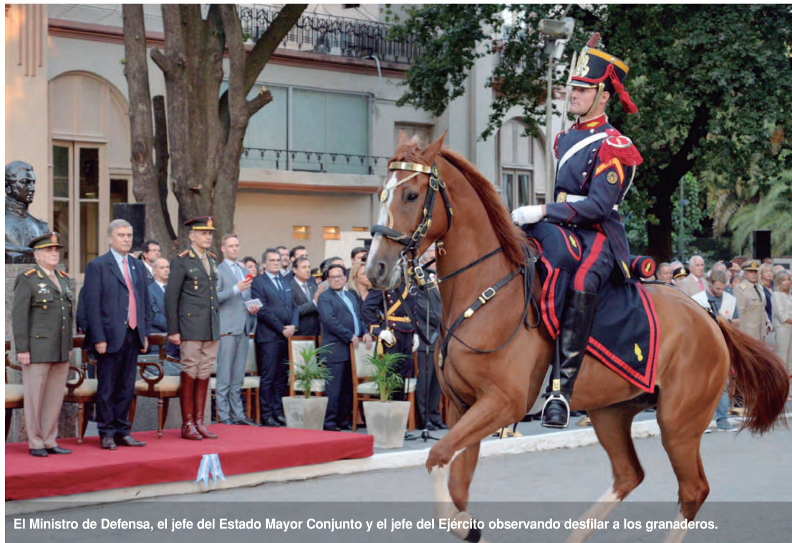
El Ministro de Defensa, el jefe del Estado Mayor Conjunto y el jefe del Ejército observando desfilan a los granaderos.

tuvieron sus batallas y ganaron. Ellos supieron cumplir con su misión. Nos toca a nosotros cumplir