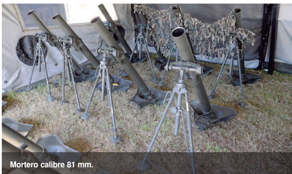
Mortero calibre 81 mm.