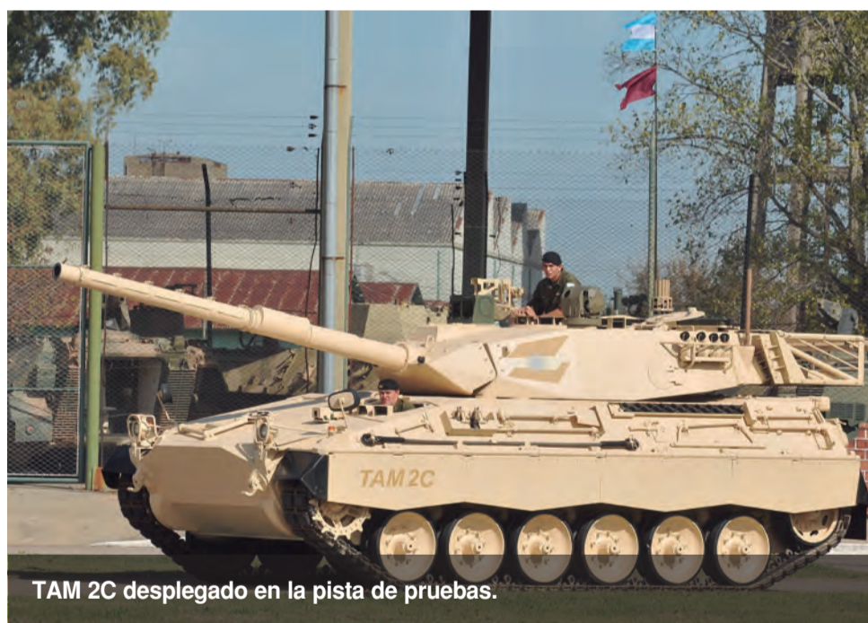
TAM 2C desplegado en la pista de pruebas.

La incorporación de material se enmarca en el Plan Director de Material del Ejército, cuyo objetivo es incrementar la capacidad operacional de la Fuerza y reforzar los elementos desplegados como parte del Operativo Integración Norte, facilitando las tareas de adiestramiento operacional, el apoyo logístico a las Fuerzas de Seguridad y el apoyo a la comunidad ante desastres naturales.