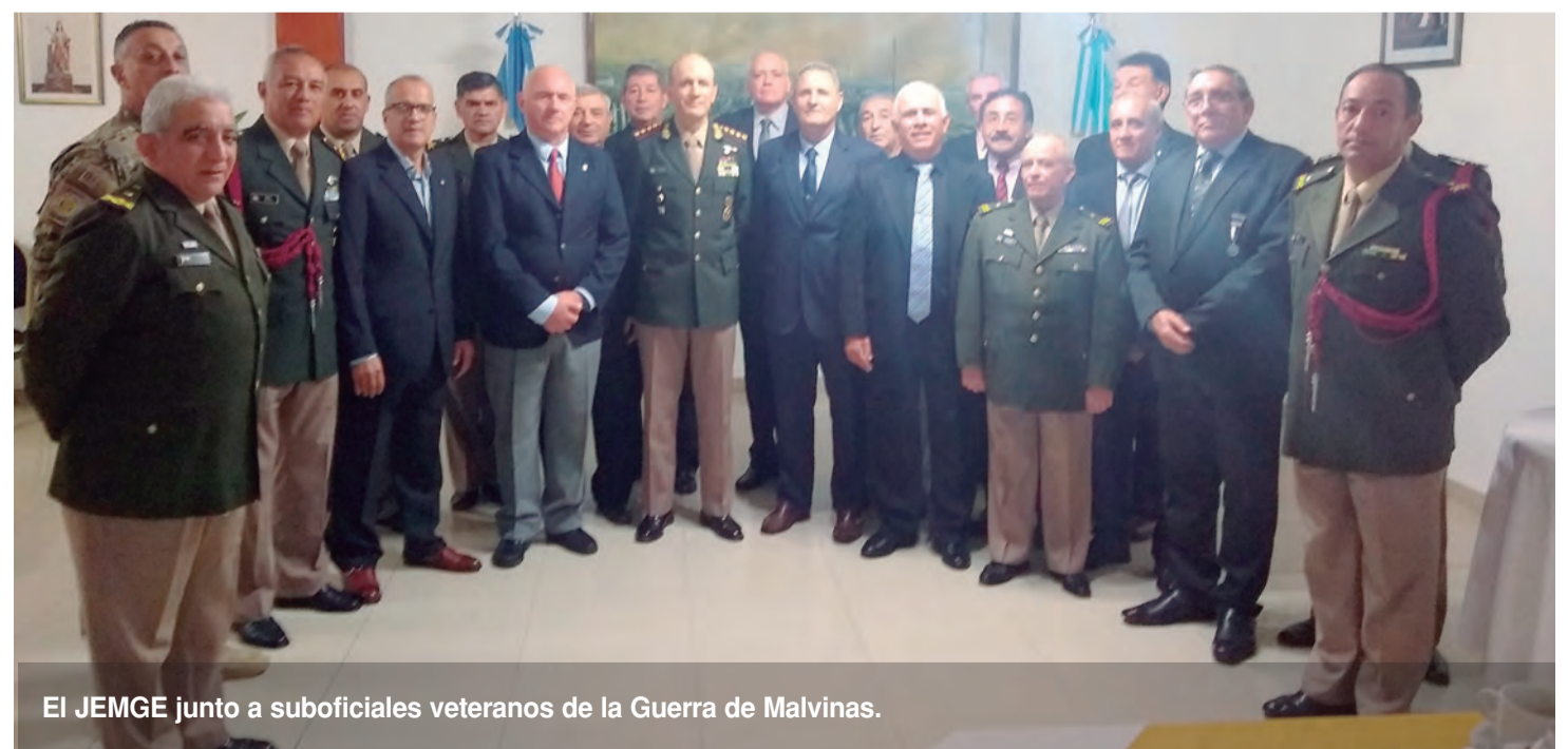
El JEMGE junto a suboficiales veteranos de la Guerra de Malvinas.

Por su parte, el suboficial mayor Vera agradeció a todos los presentes por haber participado de este encuentro, en especial resaltó la presencia de dos ex encargados de