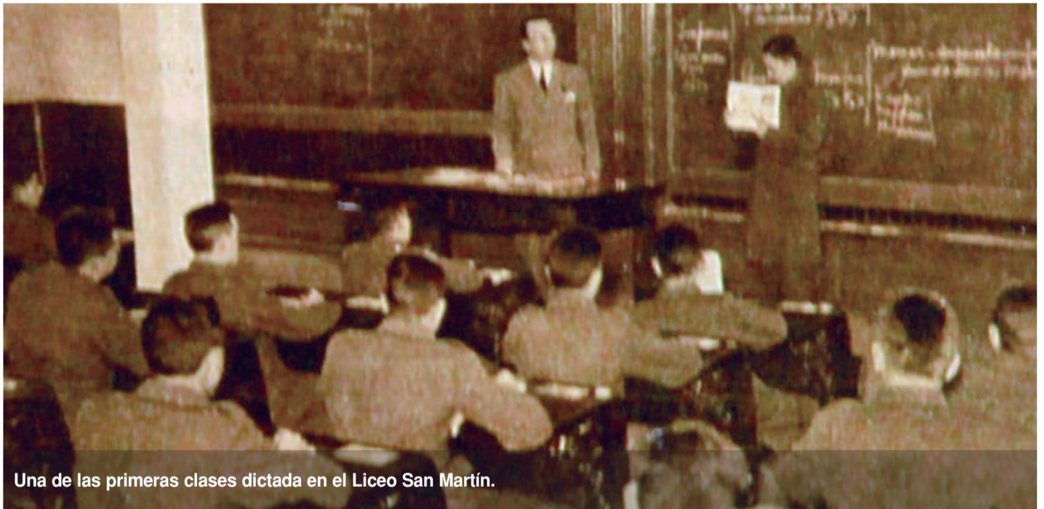
Una de las primeras clases dictada en el Liceo San Martín.

En estos 80 años de trayectoria, se destaca la identificación del egresado con el liceo y la profunda camaradería que se forja en los años de estudio, que genera una incondicional unión de por vida. Los alumnos de este bachillerato egresan con título secundario e instrucción que los capacita para ser subtenientes de reserva del arma de Infantería