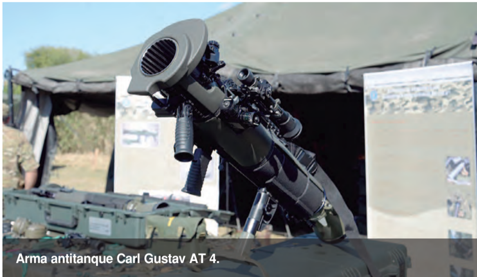
Arma antitanque Carl Gustav AT 4.