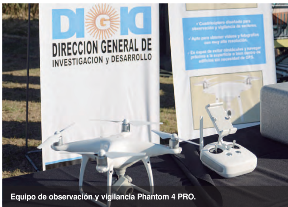
Equipo de observación y vigilancia Phantom 4 PRO.