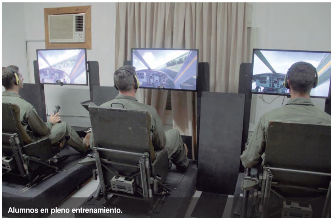
Alumnos en pleno entrenamiento.

Con un nuevo dispositivo de simulación desarrollado por integrantes de la Escuela de Aviación de Ejército se ha comenzado a entrenar a tripulaciones en operaciones tácticas.