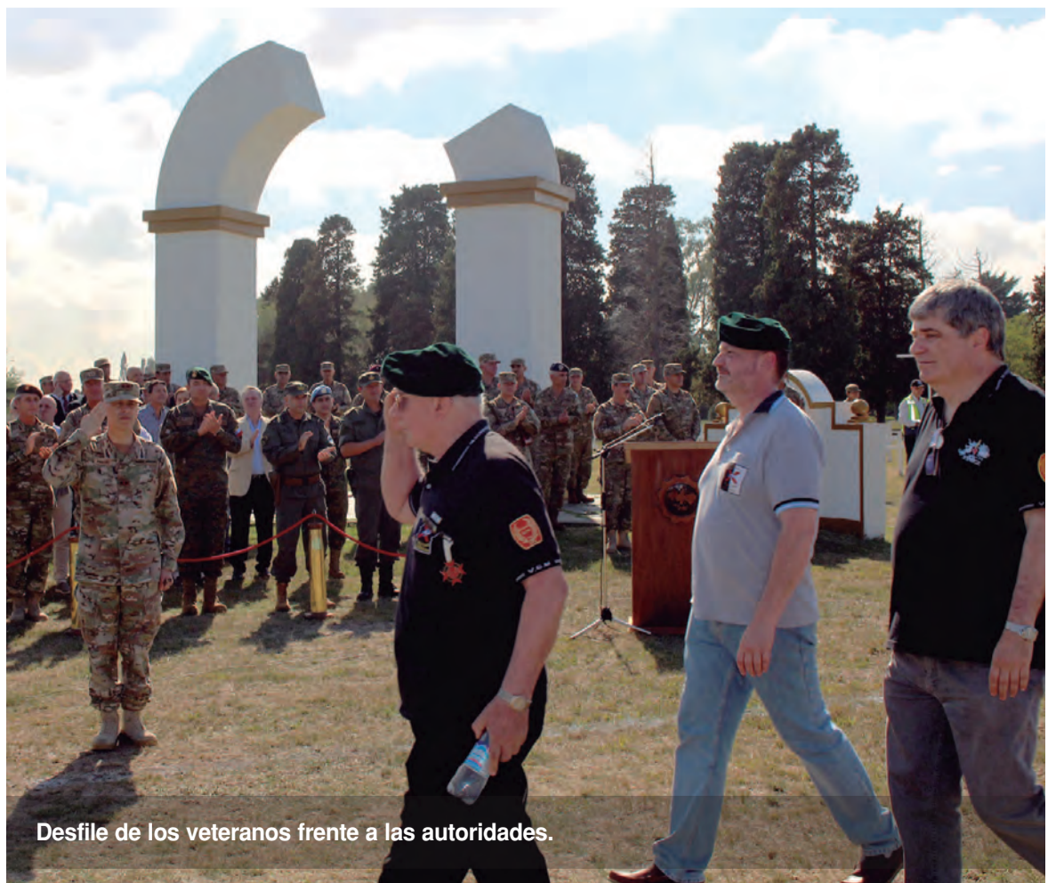
Desfile de los veteranos frente a las autoridades.