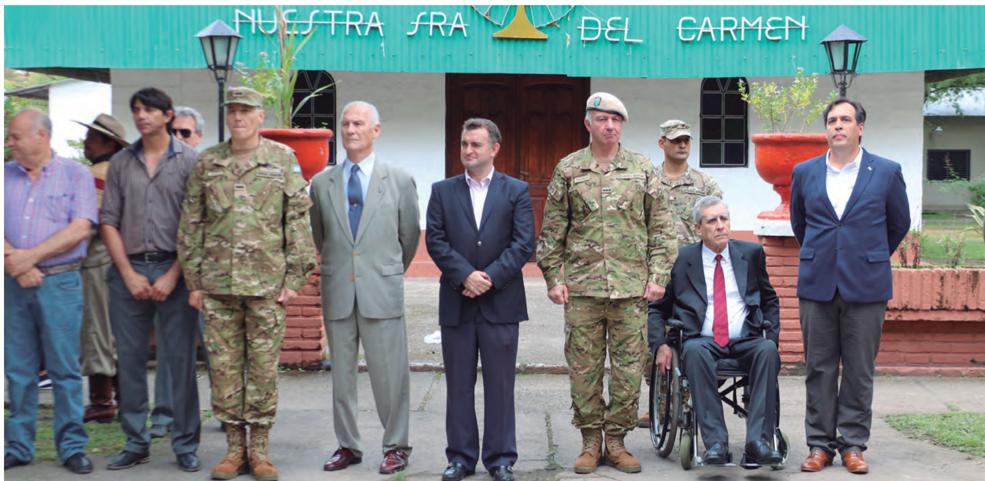
Busto homenaje al capitán ( post mortem ) Héctor Cáceres.

La Asociación de oficiales retirados de las Fuerzas Armadas "Islas Malvinas" y una delegación del Ejército homenajearon al capitán ( post mortem ) Héctor Cáceres por su valentía en combate en territorio tucumano en la década del 70.