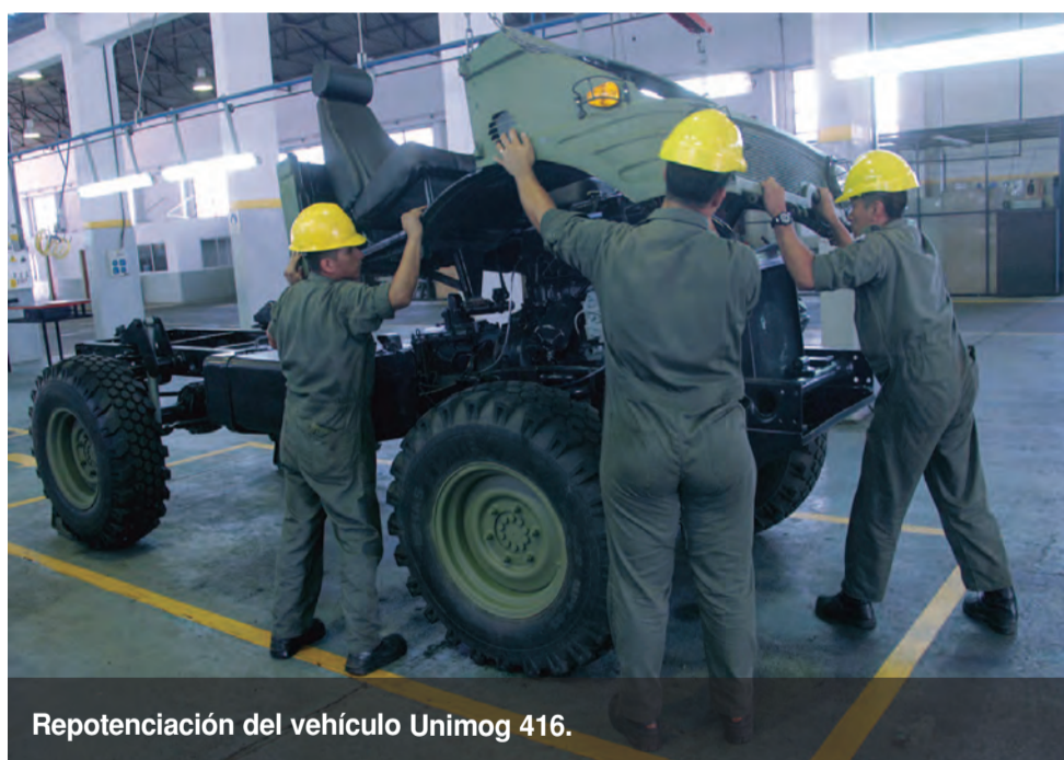
Repotenciación del vehículo Unimog 416.