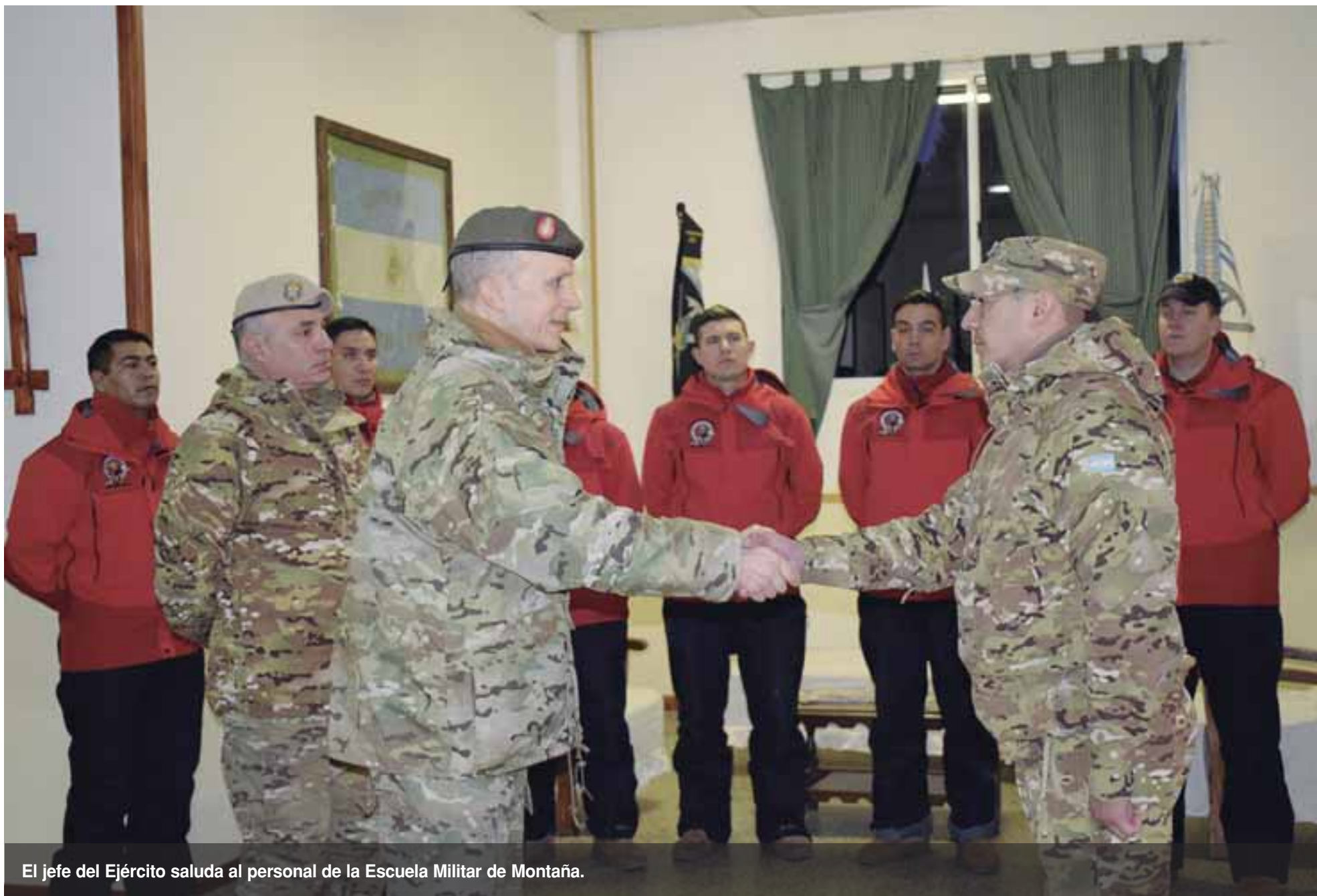
El jefe del Ejército saluda al personal de la Escuela Militar de Montaña.

El jefe del Estado Mayor General del Ejército, teniente general Claudio Ernesto Pasqualini, hizo su paso por la Escuela Militar de Montaña ubicada en la ciudad de Bariloche, Río Negro. Las actividades comenzaron con la presentación de los oficiales y el encargado de Elemento al jefe del Ejército. Seguidamente, brindó una charla a los cursantes e instructores del Curso de Montaña Invernal 2019. Para finalizar, realizó una recorrida por las instalaciones de este destacado centro de instrucción andina.