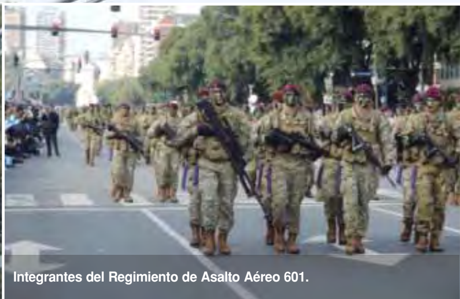
Integrantes del Regimiento de Asalto Aéreo 601.

A su vez, el personal de Aviación de Ejército hizo su pasaje aéreo con una formación