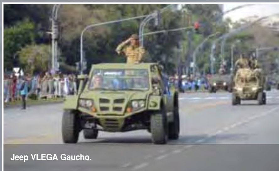
Jeep VLEGA Gaucho.