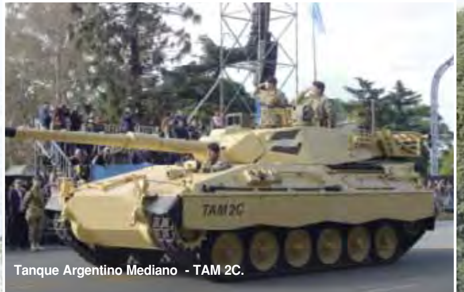
Tanque Argentino Mediano - TAM 2C.