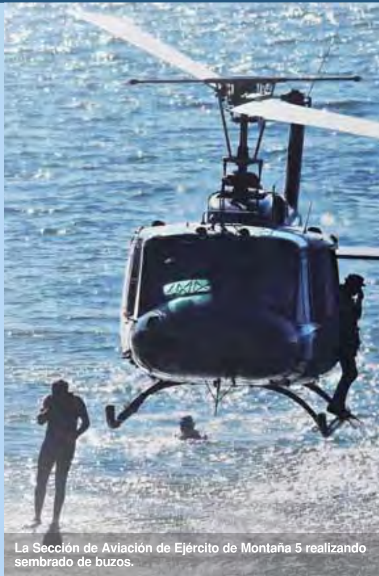
La Sección de Aviación de Ejército de Montaña 5 realizando sembrado de buzos.