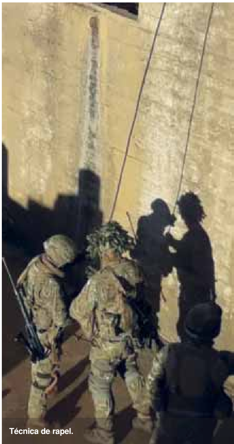
Técnica de rapel.

tiradores especiales, infiltración nocturna, exploración, reconocimiento del linde y guiado de los elementos de asalto, tiro aplicativo al combate en localidades con FAL, FAMCa, escopeta, MAG y fusiles de tiradores especiales