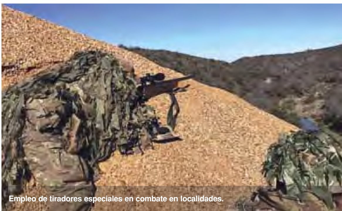
Empleo de tiradores especiales en combate en localidades.