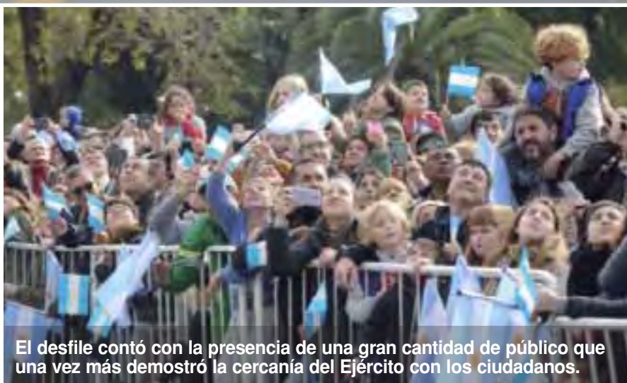
El desfile contó con la presencia de una gran cantidad de público que una vez más demostró la cercanía del Ejército con los ciudadanos.