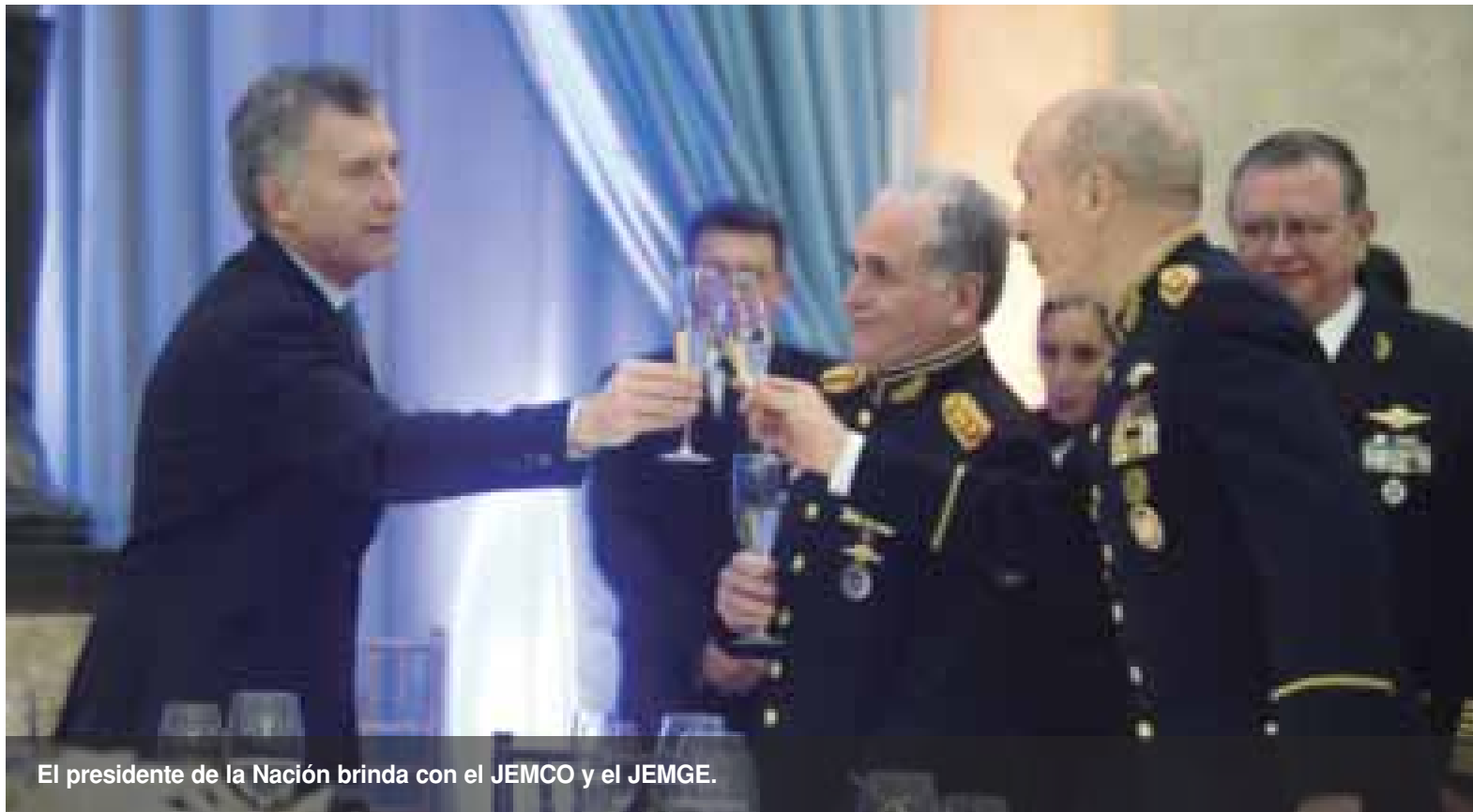
El presidente de la Nación brinda con el JEMCO y el JEMGE.

“Es un honor participar por cuarto año consecutivo de la cena de camaradería y poner en valor a la enorme tarea silenciosa y permanente que lleva adelante esta gran familia militar, que lo hace con profesionalismo y un enorme espíritu de servicio que los prestigia.