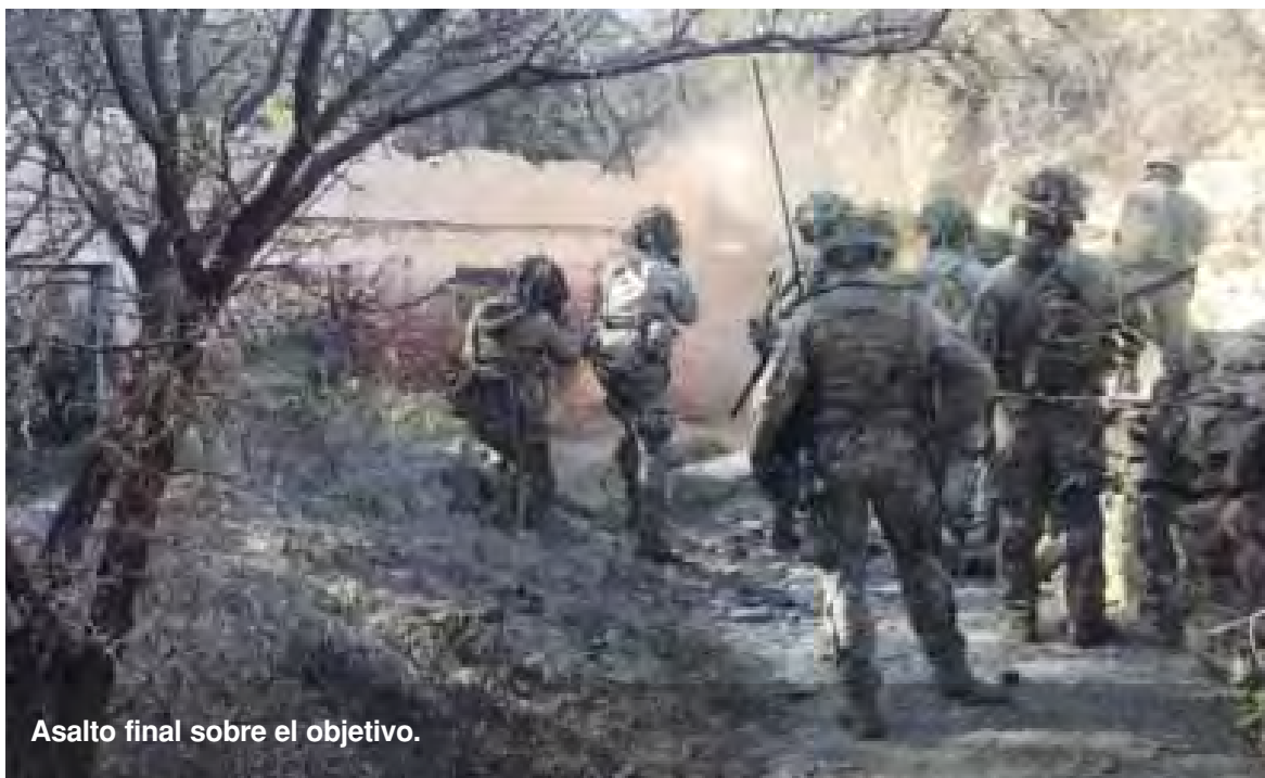
Asalto final sobre el objetivo.