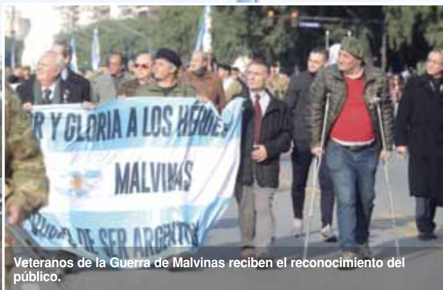
Veteranos de la Guerra de Malvinas reciben el reconocimiento del público.