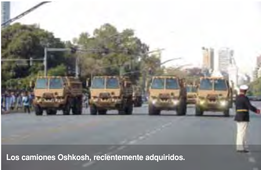
Los camiones Oshkosh, recientemente adquiridos.