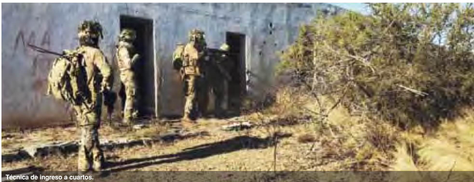
Técnica de ingreso a cuartos.