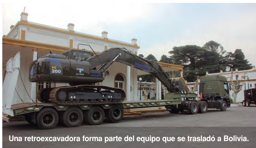
Una retroexcavadora forma parte del equipo que se trasladó a Bolivia.