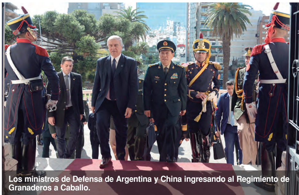
Los ministros de Defensa de Argentina y China ingresando al Regimiento de Granaderos a Caballo.