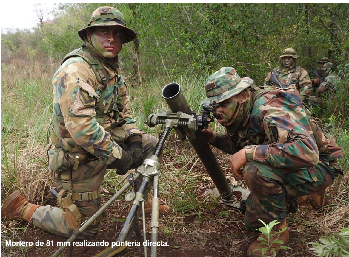
Mortero de 81 mm realizando puntería directa.