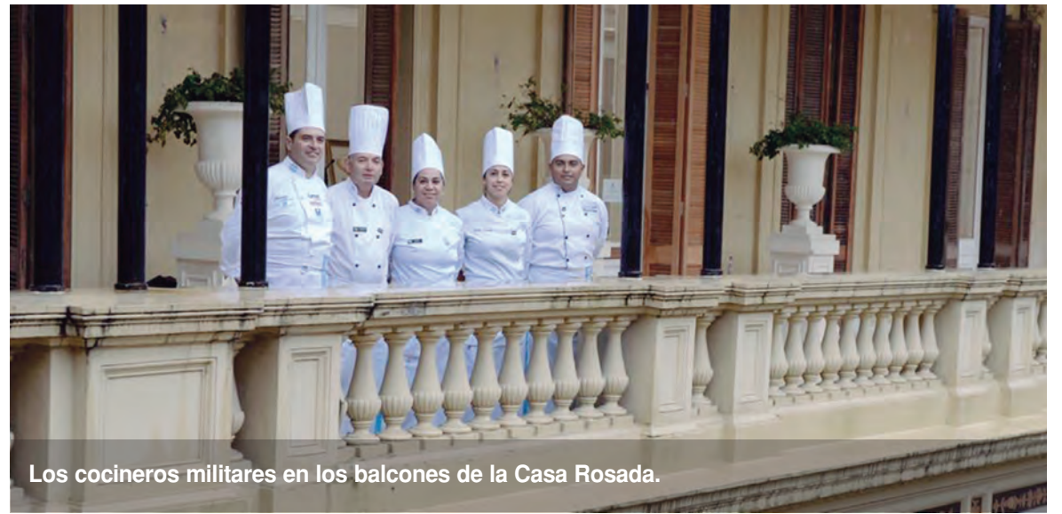
Los cocineros militares en los balcones de la Casa Rosada.