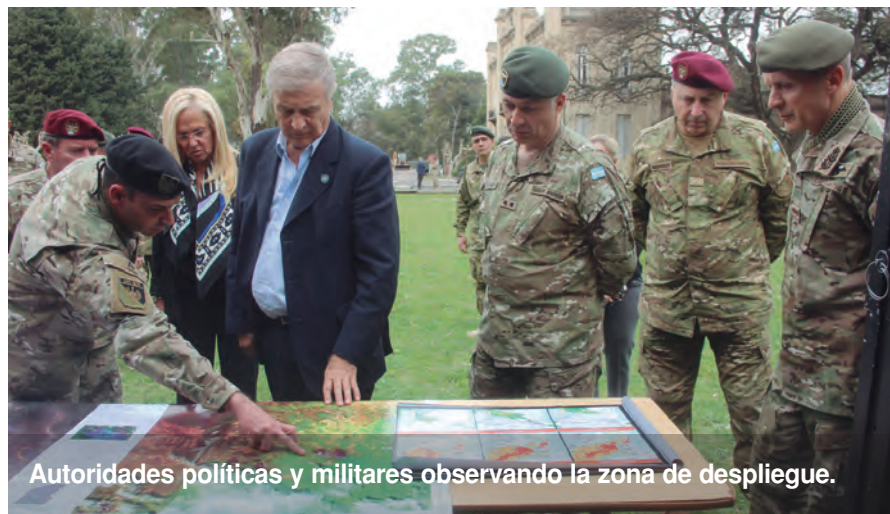
Autoridades políticas y militares observando la zona de despliegue.