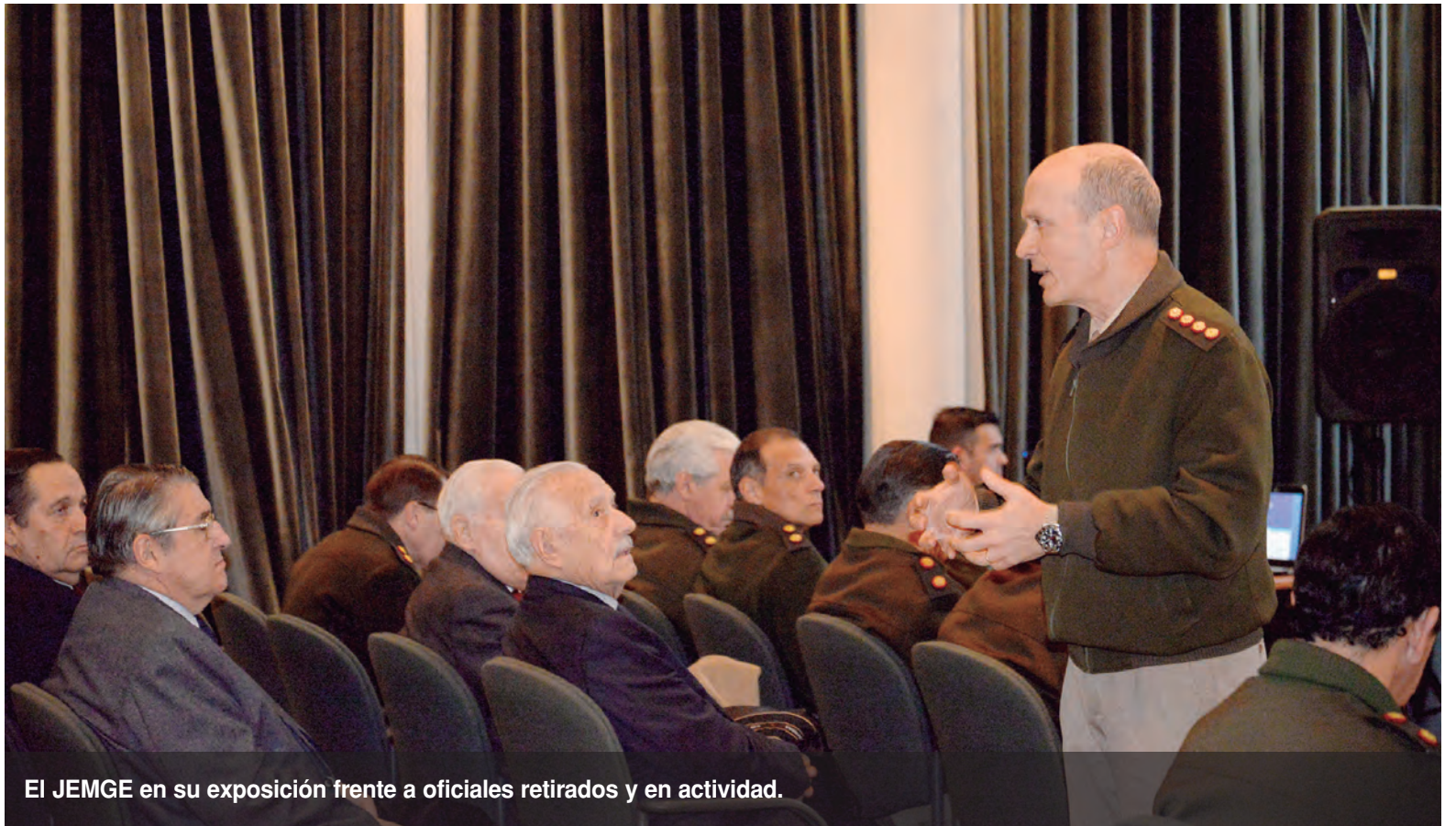
El JEMGE en su exposición frente a oficiales retirados y en actividad.