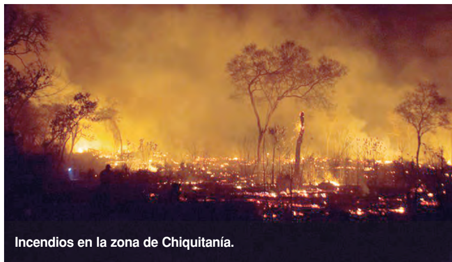
Incendios en la zona de Chiquitanía.

Llegamos a Bolivia a través del paso internacional Salvador Mazza (Argentina) - Yacuiba (Bolivia) en tres columnas: la primera estuvo compuesta por 93 hombres y 18 vehículos, quienes arribaron a Santa Cruz de la Sierra. La