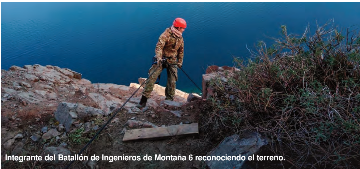
Integrante del Batallón de Ingenieros de Montaña 6 reconociendo el terreno.