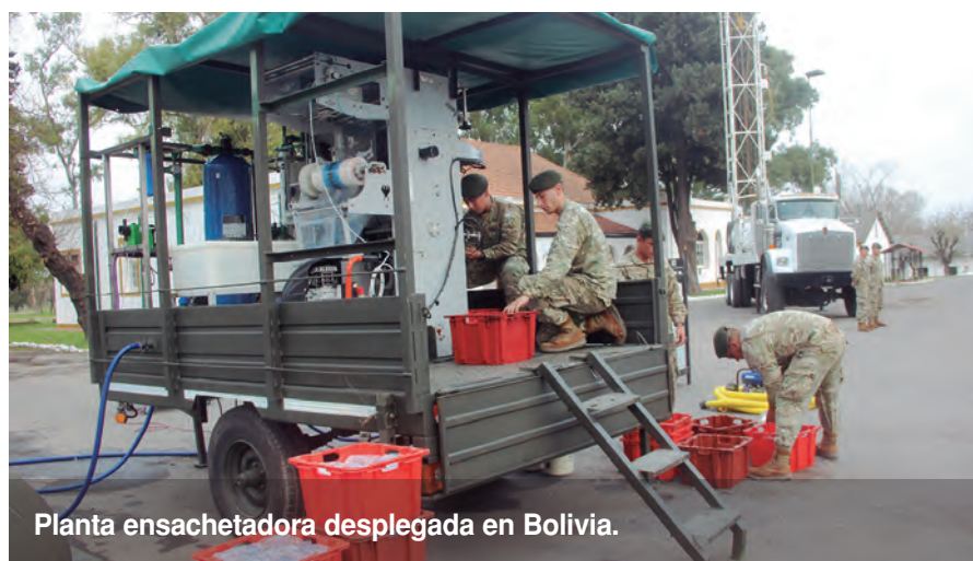
Planta ensachadora desplegada en Bolivia.