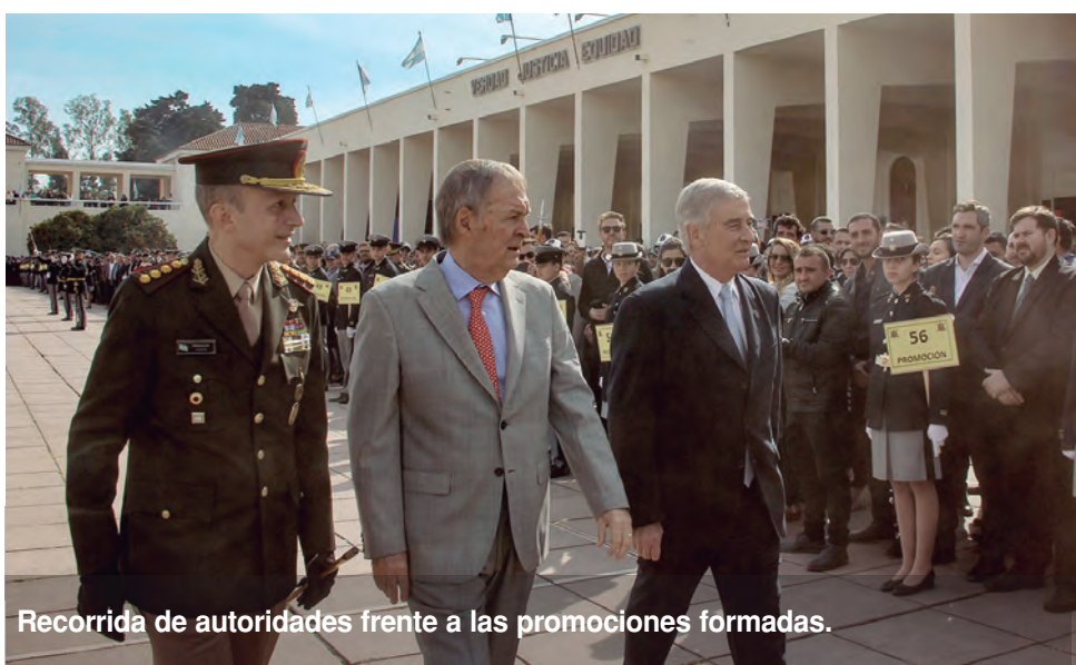
Recorrida de autoridades frente a las promociones formadas.