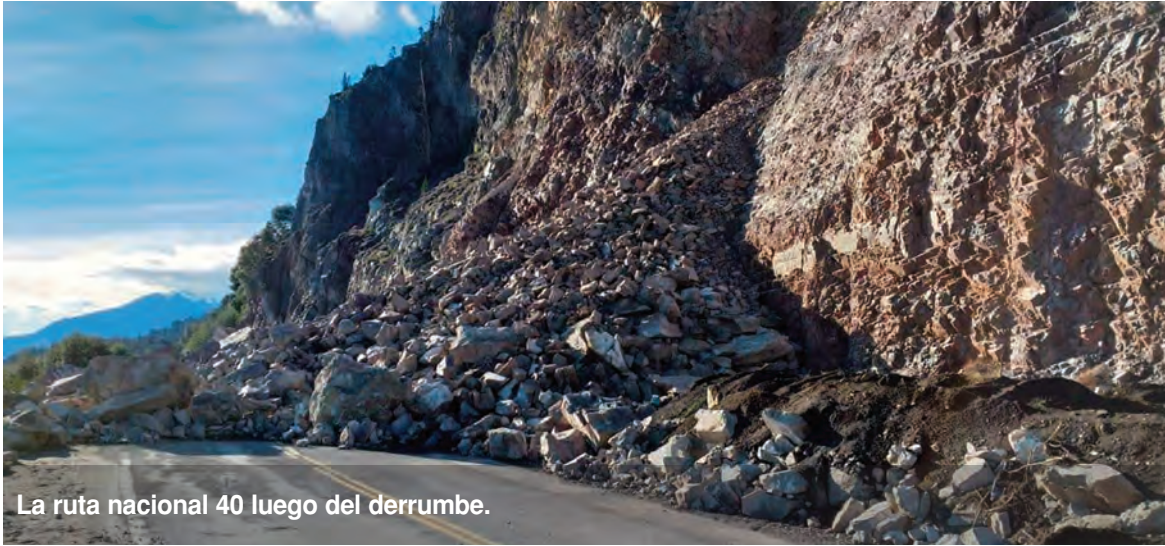
La ruta nacional 40 luego del derrumbe.