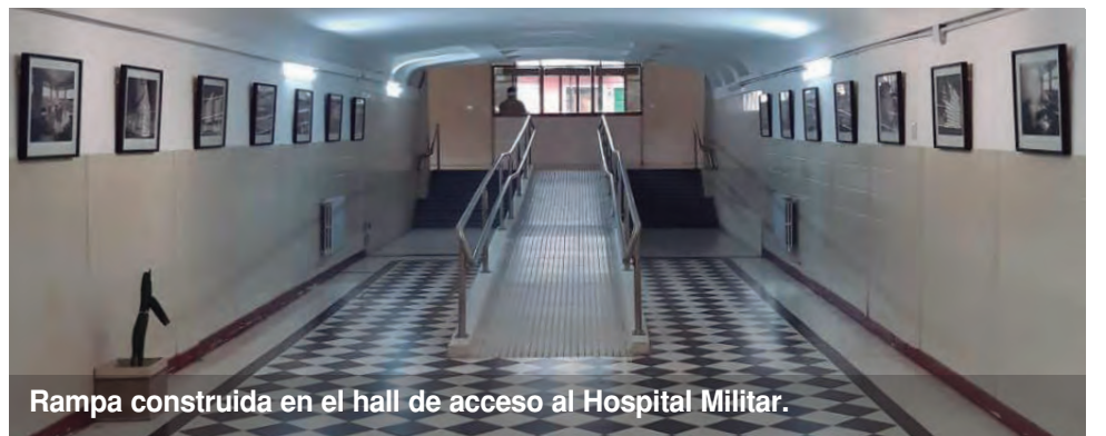
Rampa construida en el hall de acceso al Hospital Militar.

-Llevamos adelante distintas obras en los servicios de Video Endoscopia, Radiología, Odontología, Implantes, Radiología Odontológica, Buco Maxilofacial, Otorrinolaringología, Gastroenterología, Anatomía Patológi-