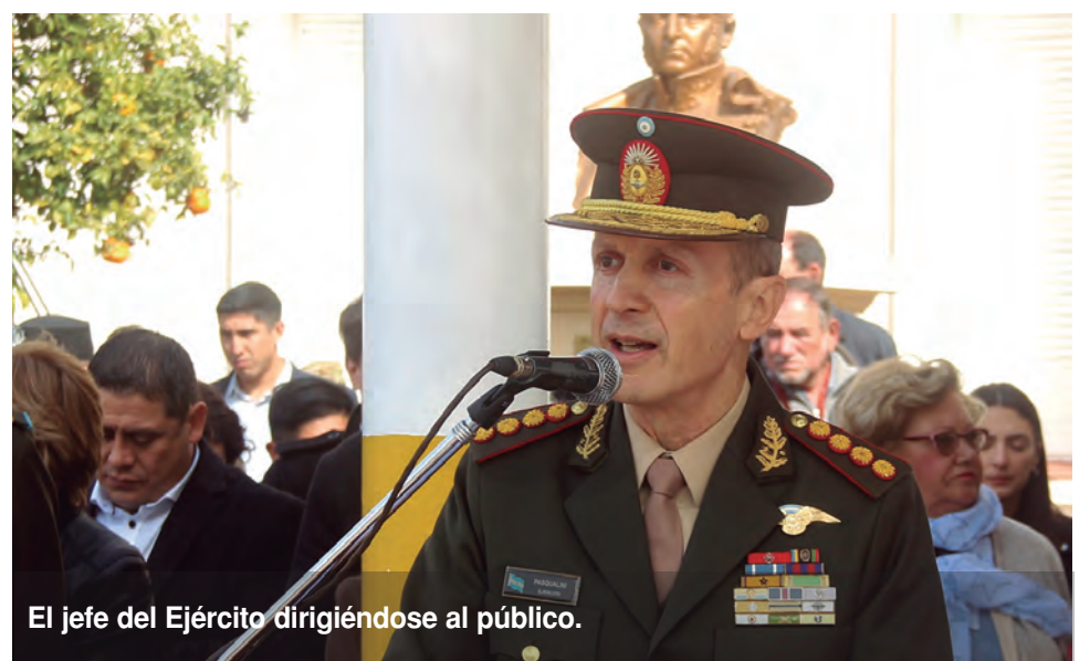
El jefe del Ejército dirigiéndose al público.