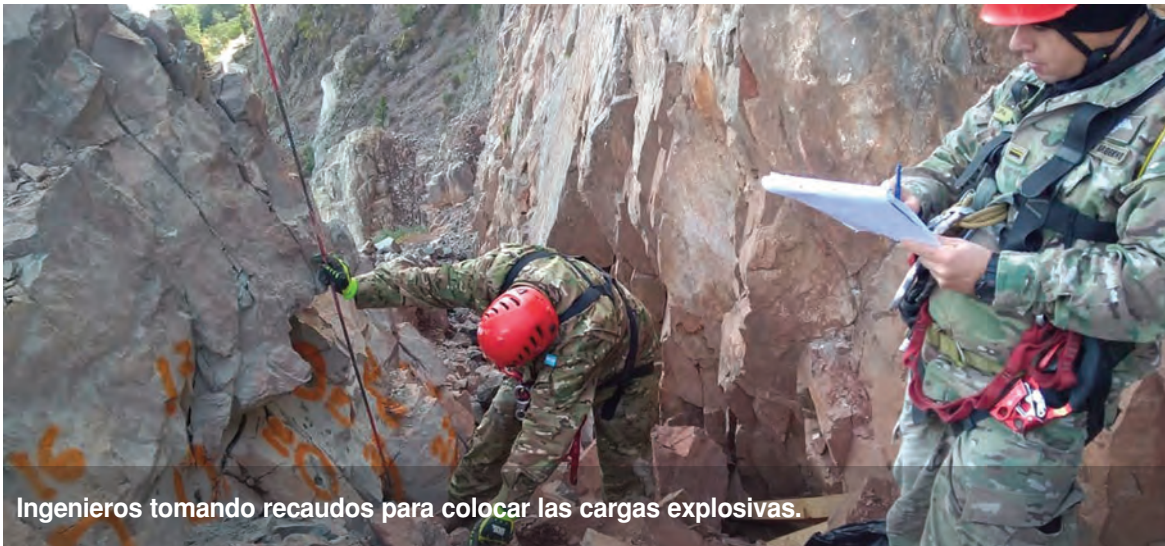
Ingenieros tomando recaudos para colocar las cargas explosivas.