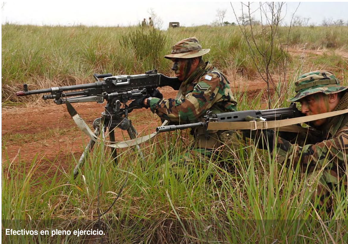
Efectivos en pleno ejercicio.

Cabe destacar que todas las actividades operacionales fueron ejecutadas con munición de foguero, simuladores de explosión, elementos fumígenos y subcalibres de morteros; lo cual permite entrenar a las fracciones con el realismo necesario.