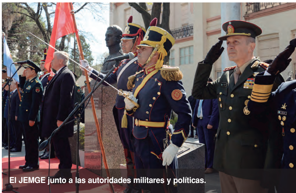
El JEMGE junto a las autoridades militares y políticas.