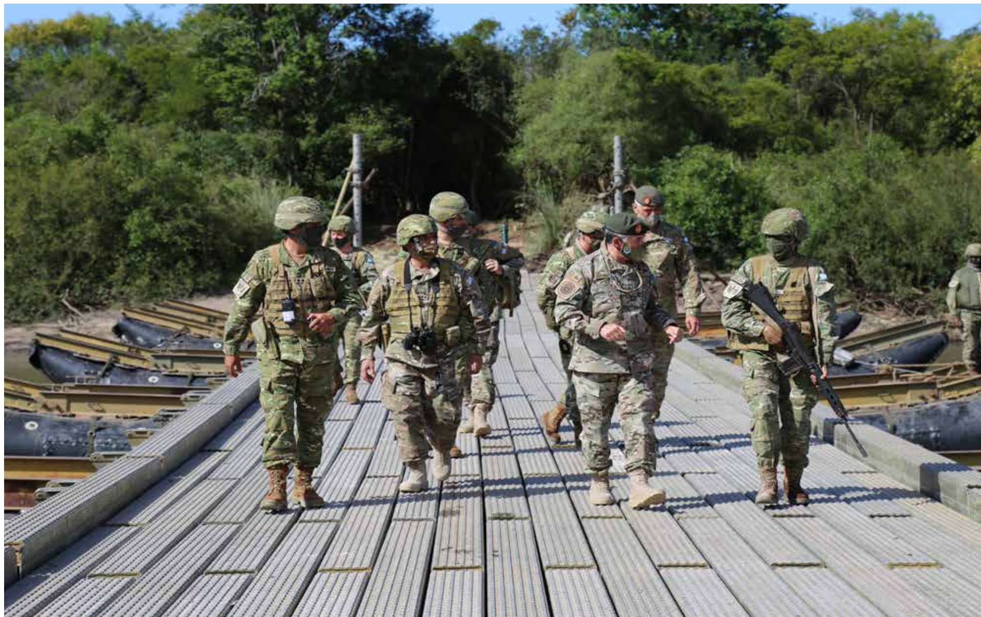
Visita del jefe del Ejército A la Guarnición Militar Santa Rosa