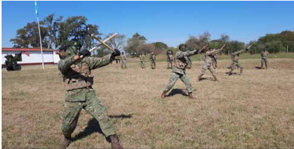
Técnica con palo.

El Grupo de Artillería de Monte 12 finalizó un Cursillo de combate cuerpo a cuerpo y defensa personal operativa, indispensables para el adiestramiento operacional de cuadros y tropa.