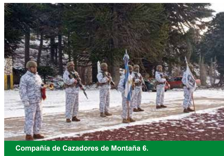
Compañía de Cazadores de Montaña 6.