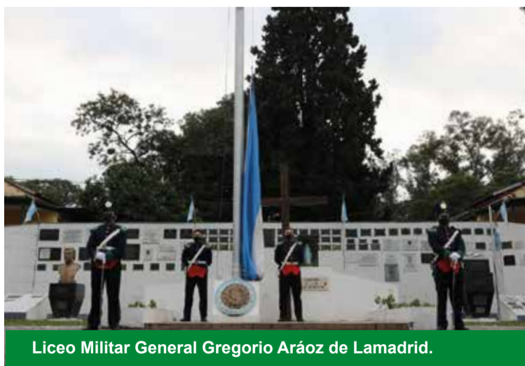
Liceo Militar General Gregorio Aráoz de Lamadrid.