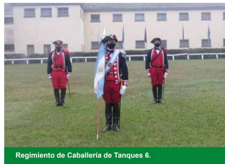
Regimiento de Caballería de Tanques 6.