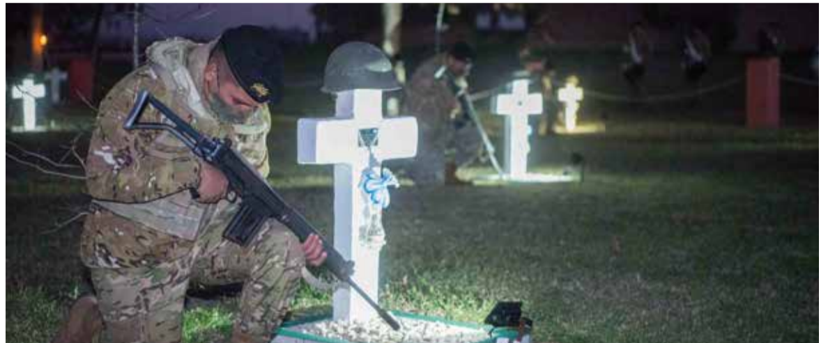
Efectivos de la Guarnición Ejército Arana rinden homenaje a los caídos en Malvinas.

E l 11 y 12 de junio de 1982 se produjo el combate de Monte Longdon, en el que 36 miembros del Regimiento de Infantería Mecanizado 7 y seis del Escuadrón de Exploración de Caballería Blindado 1 perdieron la vida en cumplimiento del deber. Es considerada una de las batallas más emblemáticas del conflicto por dos razones: por cruenta, de combates cuerpo a cuerpo con bayoneta -poco usual en la guerra moderna-, y por su punto estratégico debido a que se trataba de una posición clave en torno a la guarnición argentina asentada en Puerto Argentino. Es por ello que todos los años se homenajea a los valientes héroes que supieron defender con su vida a la bandera y a la Nación.