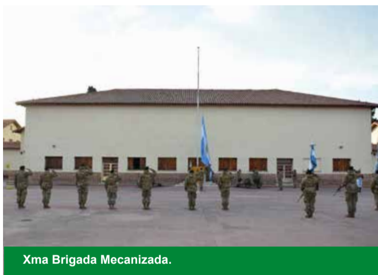
Xma Brigada Mecanizada.