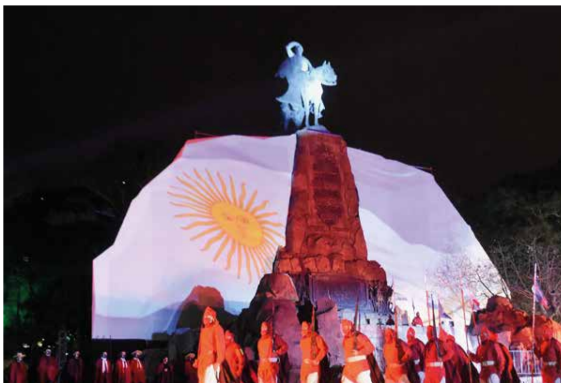
Desfile de los Infemales frente al monumento al general Güemes en Salta.