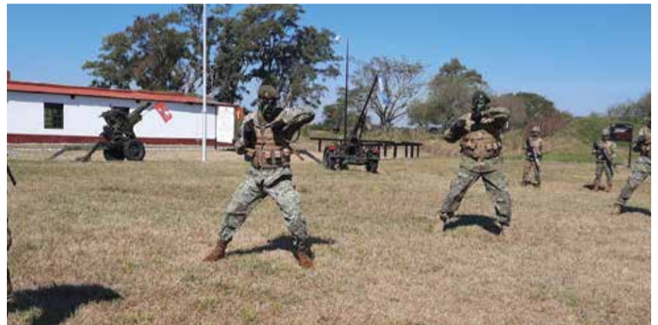
Técnica con cuchillos.

En este cursillo, 30 integrantes de la Guarnición Ejército Mercedes, participaron de un intenso entrenamiento tanto mental como físico, en el que adquirieron una serie de conocimientos y aptitudes propios del combatiente individual en situaciones de enfrentamientos extremos.