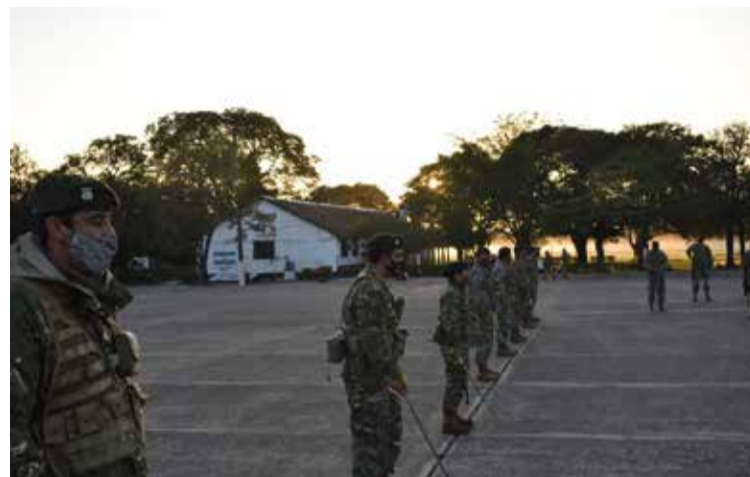
Regimiento de Infantería de Monte 29.