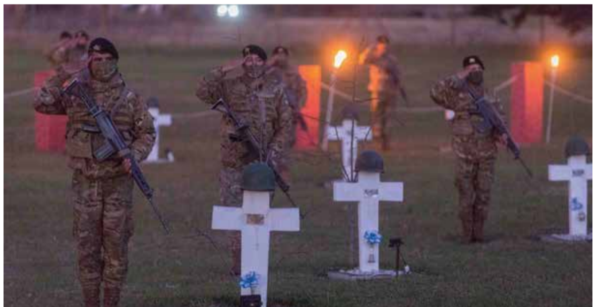
Saludo a los eternos custodios de las Islas Malvinas.