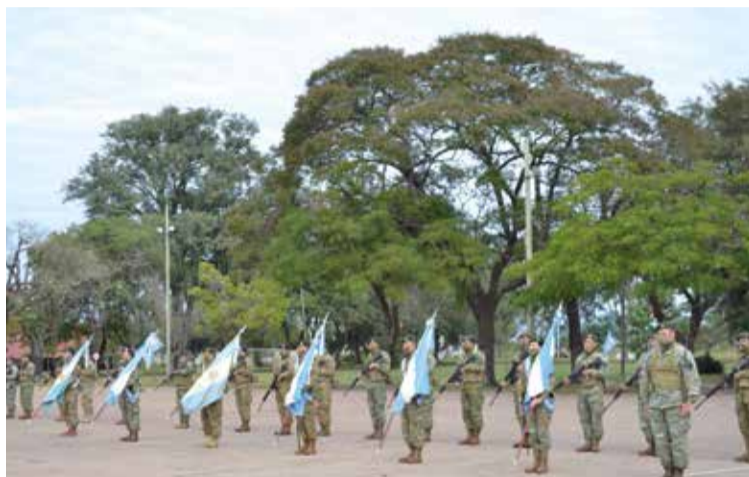
IIIra Brigada de Monte.

Por su parte, el Regimiento de Caballería de Tanques 6, el Regimiento de Infantería Mecanizado 5 y el comando de la XIra Brigada Mecanizada comenzaron sus actividades diarias con las ceremonias destinadas al día de la Bandera y recordando el legado de Belgrano.