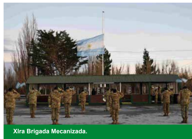
XIra Brigada Mecanizada.