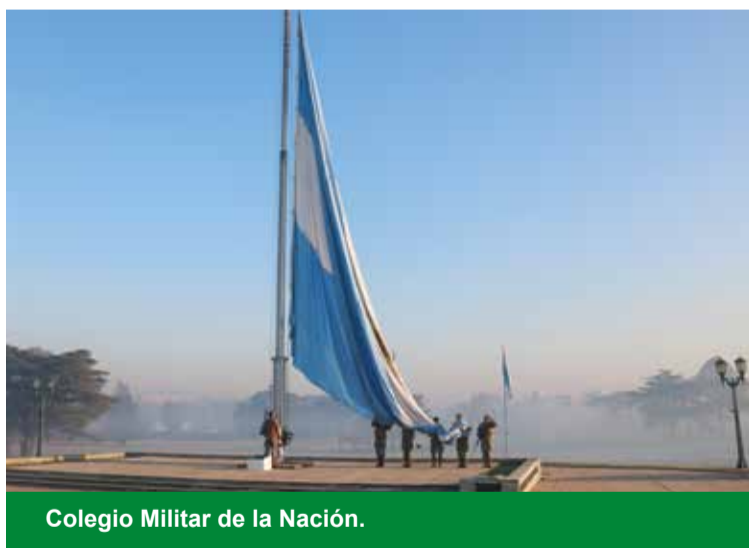
Colegio Militar de la Nación.