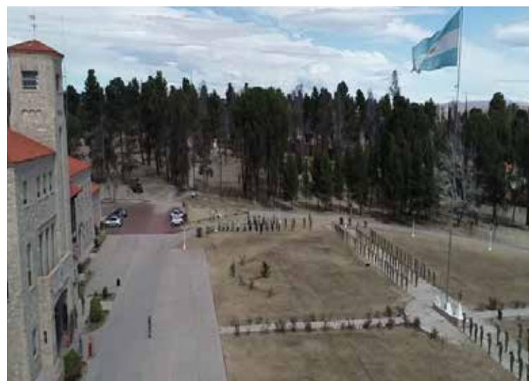
Regimiento de Infantería de Montaña 10.