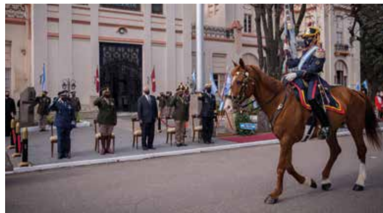
Regimiento de Granaderos a Caballo.