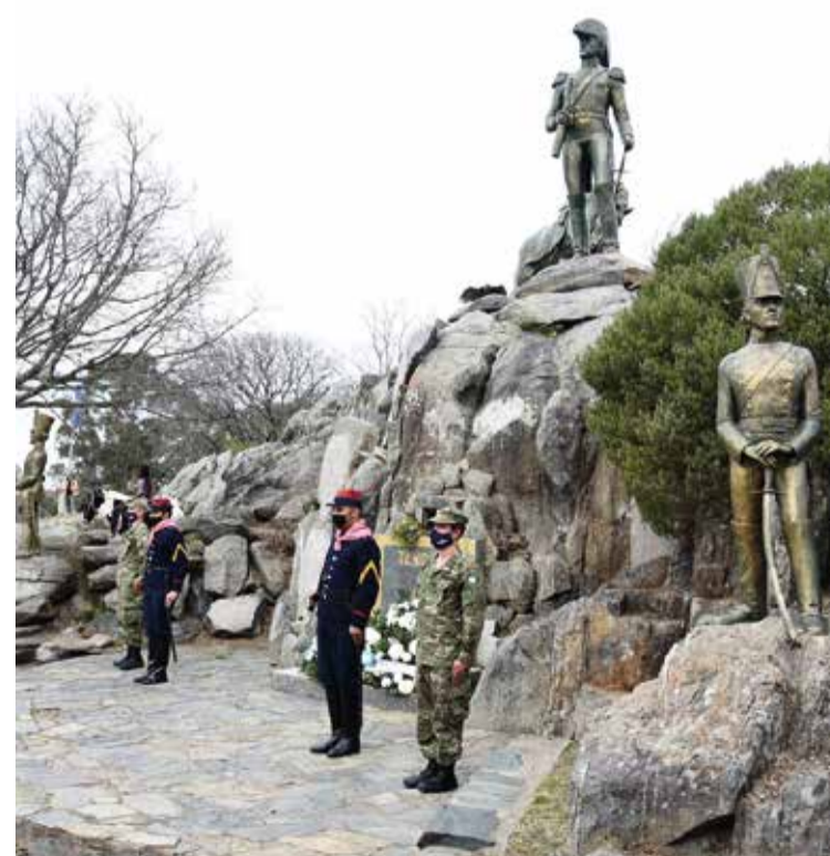
Guarnición Ejército Tandil.