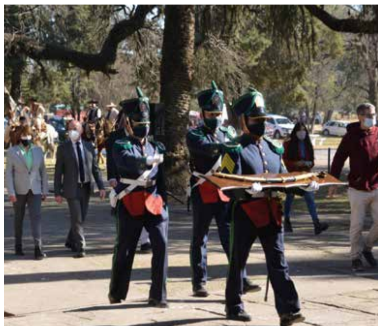
Liceo Militar Gral. Gregorio Aráoz de Lamadrid.