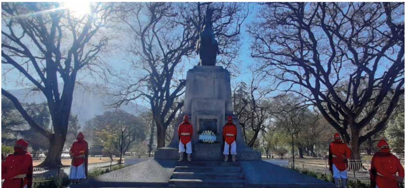
Vta Brigada de Montaña.