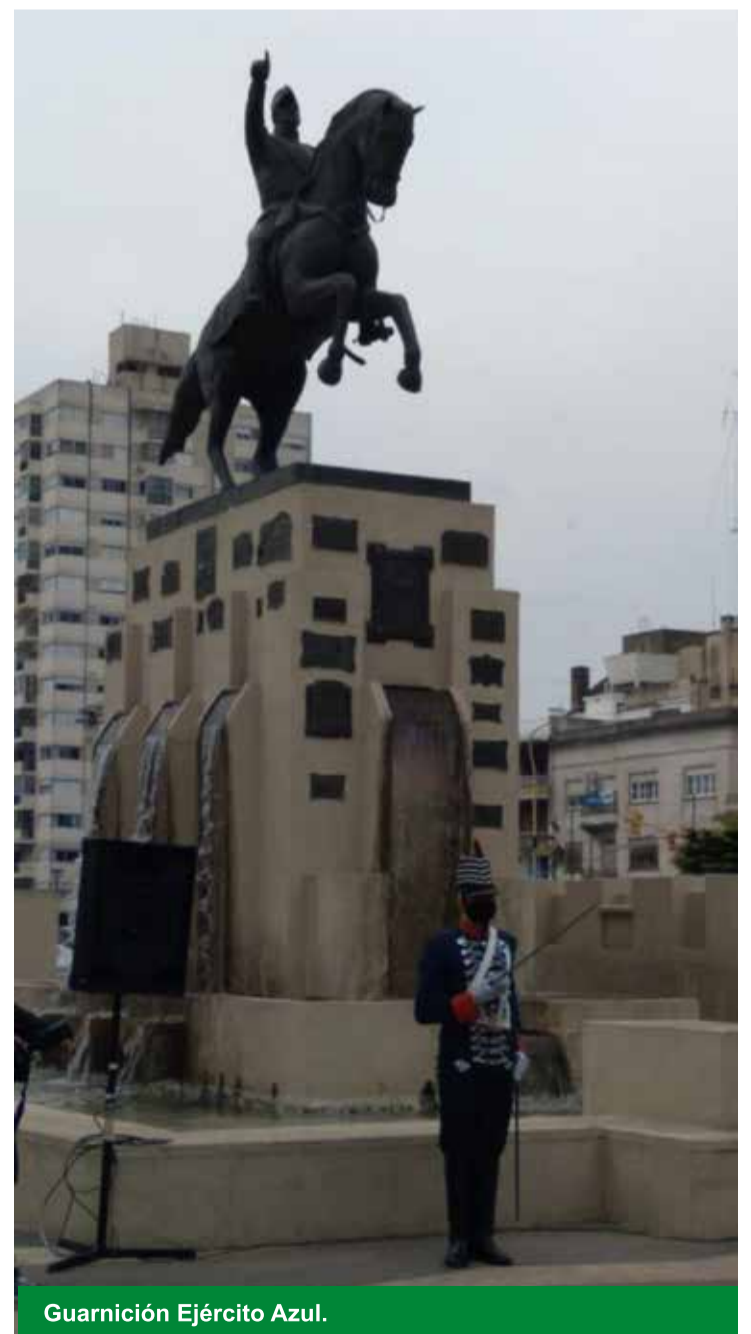
Guarnición Ejército Azul.

Un día antes de las celebraciones por el paso a la inmortalidad del General José de San Martín, se conmemoró esta efeméride en el barrio Rodríguez Peña de Comodoro Rivadavia. El festejo contó con la presencia de diferentes autoridades municipales, miembros de las Fuerzas Armadas y de Seguridad, veteranos de la Guerra de Malvinas y vecinos. El acto contribuyó a honrar las hazañas que realizó el fundador del Regimiento de Granaderos a