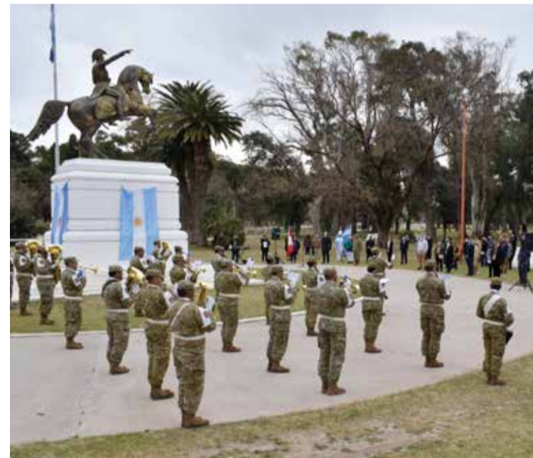
Guarnición Ejército Bahía Blanca.