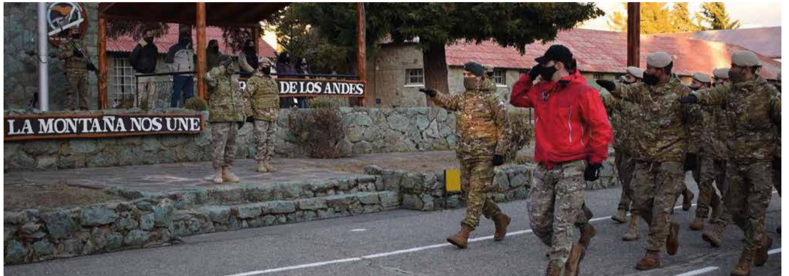
Equipo Militar de Esquí.

En la ciudad de Bariloche, el jefe del Ejército visitó la Escuela Militar de Montaña. Las actividades iniciaron con una formación en la plaza de armas del instituto, donde estuvieron presentes los integrantes del Curso Avanzado de Montaña Invernal, personal de la Escuela Militar de Montaña, la Sección de Inteligencia de Montaña Bariloche y el