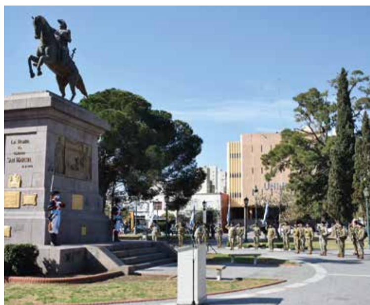
Xma Brigada Mecanizada.